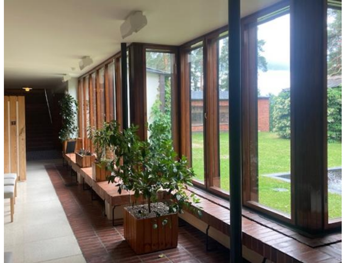
Alvar Aalto: Säynätsalon kunnantalo, 1952.