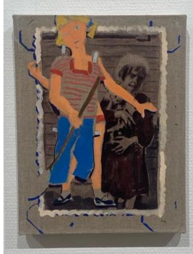
Maaria Jokimies: Pistän merkkejä sinne tänne VII, 2023.