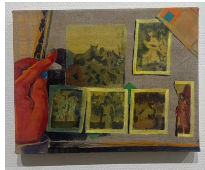
Maaria Jokimies: Pistän merkkejä sinne tänne II, 2023.