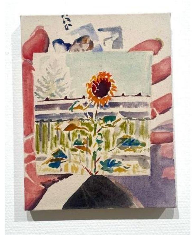
Maaria Jokimies: Pistän merkkejä sinne tänne III, 2023.