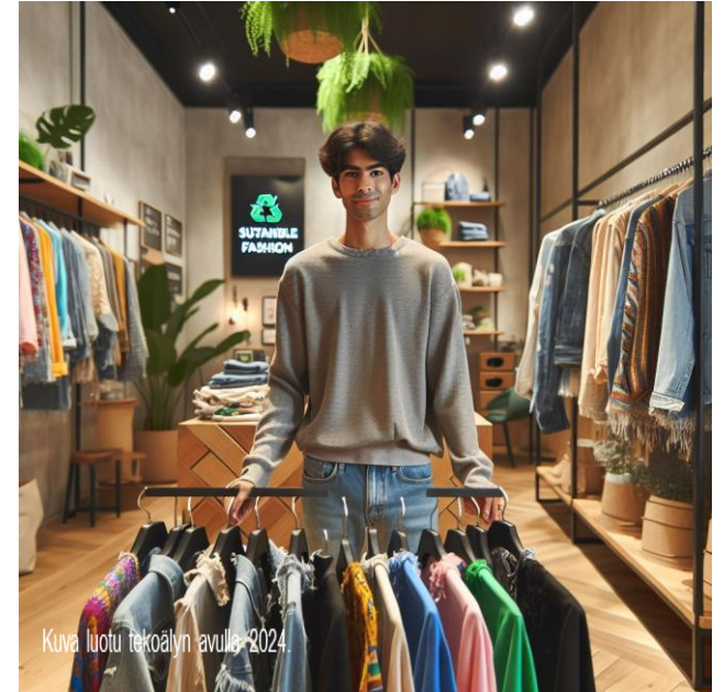
Kuva luotu tekoälyn avulla 2024.