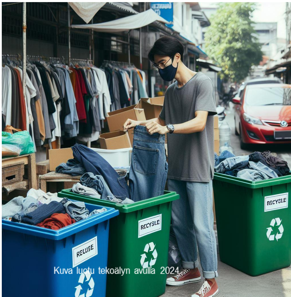
Kuva luotu tekoälyn avulla 2024