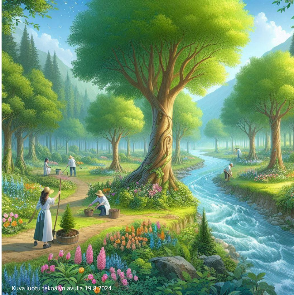
Kuva luotu tekoälyn avulla 19.8.2024.

Ylikulutus tarkoittaa sitä, että ihmiskunta kuluttaa luonnonvaroja enemmän kuin maapallon rajoissa on kestävää. Kulutamme luontoa nopeammin kuin se kykenee uusiutumaan. Ylikulutus aiheuttaa luontokatoa ja ilmastonmuutosta.