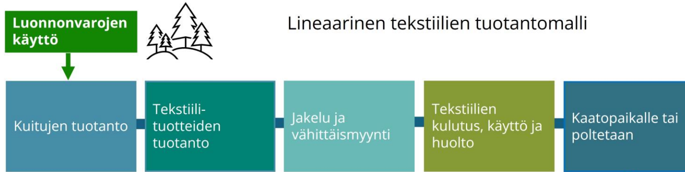
Kuvio. Lineaarinen malli (Guldmann 2016) (kääntänyt Heidi Mattila ja Minna Parkko)

Lähteet: Euroopan parlamentti 2023. Mitä kiertotalous on ja miksi sillä on merkitystä? Artikkel. Mitä kiertotalous on ja miksi sillä on merkitystä? | Ajankohtaista | Euroopan parlamentti (europa.eu) Euroopan komissio 2022. Komission tiedonanto Euroopan parlamentille, neuvostolle, Euroopan talous- ja sosiaalikomitealle ja alueiden komitealle. Kestäviä ja kiertotalouteen perustuvia tekstiilejä koskeva EU:n strategia. resource.html (europa.eu) Guldmann, E. 2016. Best Practice Examples of Circular Business Models. (1 ed.) Danish Environmental Protection Agency/ Miljøstyrelsen. http://www2.mst.dk/Udgiv/publications/2016/06/978-87-93435-86-5.pdf