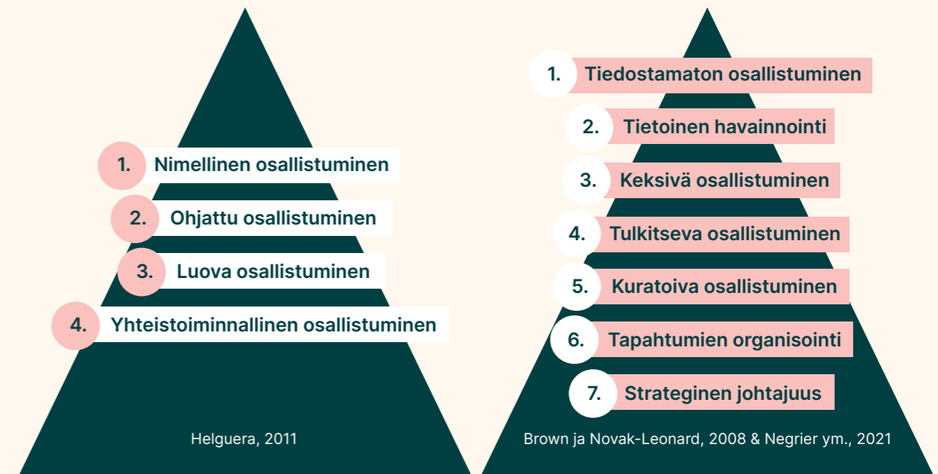
Kuvio 2. Taiteeseen ja taiteessa osallistumisen tasoja