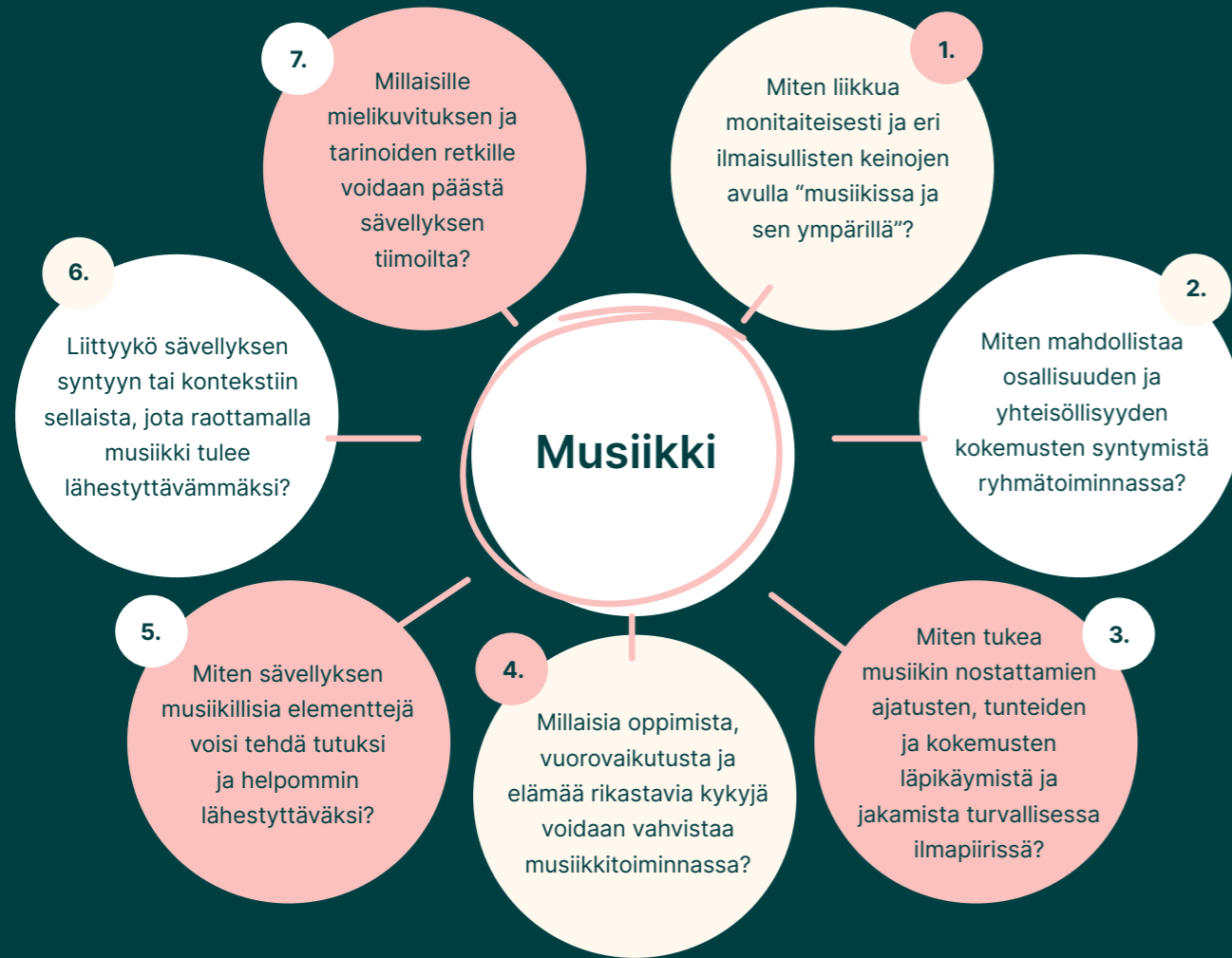
Kuvio 1. Yleisötyön pedagogisia polkuja (muokattu Huhtinen-Hildén & Pitt, 2018 pohjalta)

Olen koonnut seuraavaan kuvioon pohdittavia näkökulmia pedagogisen toiminnan toteuttamiseksi osana yleisötyötä: