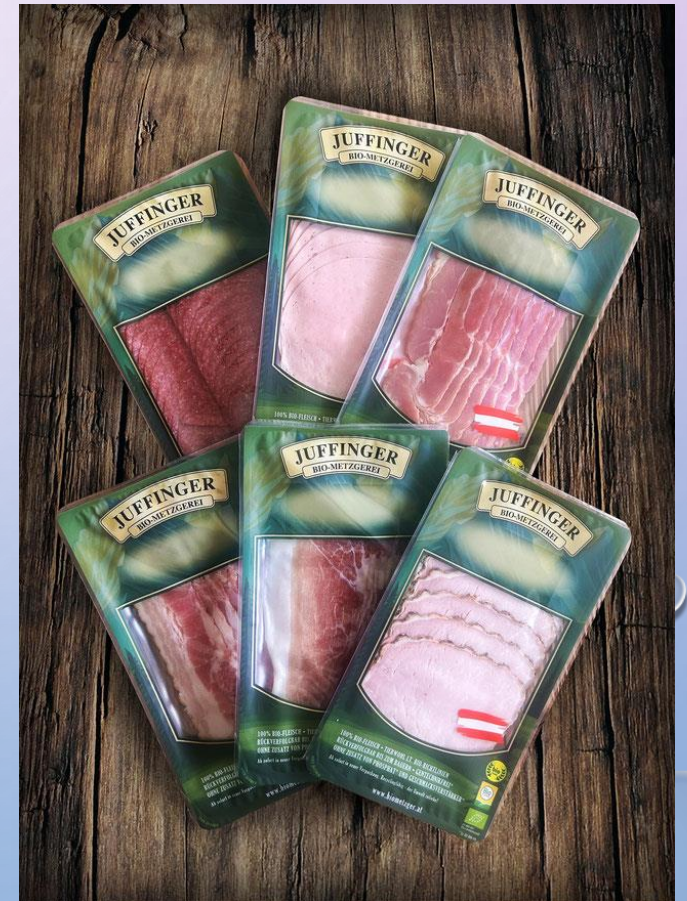
Purro back to meat