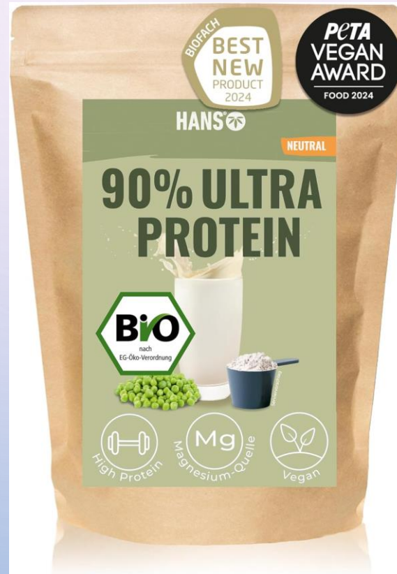
Other Grocery Products