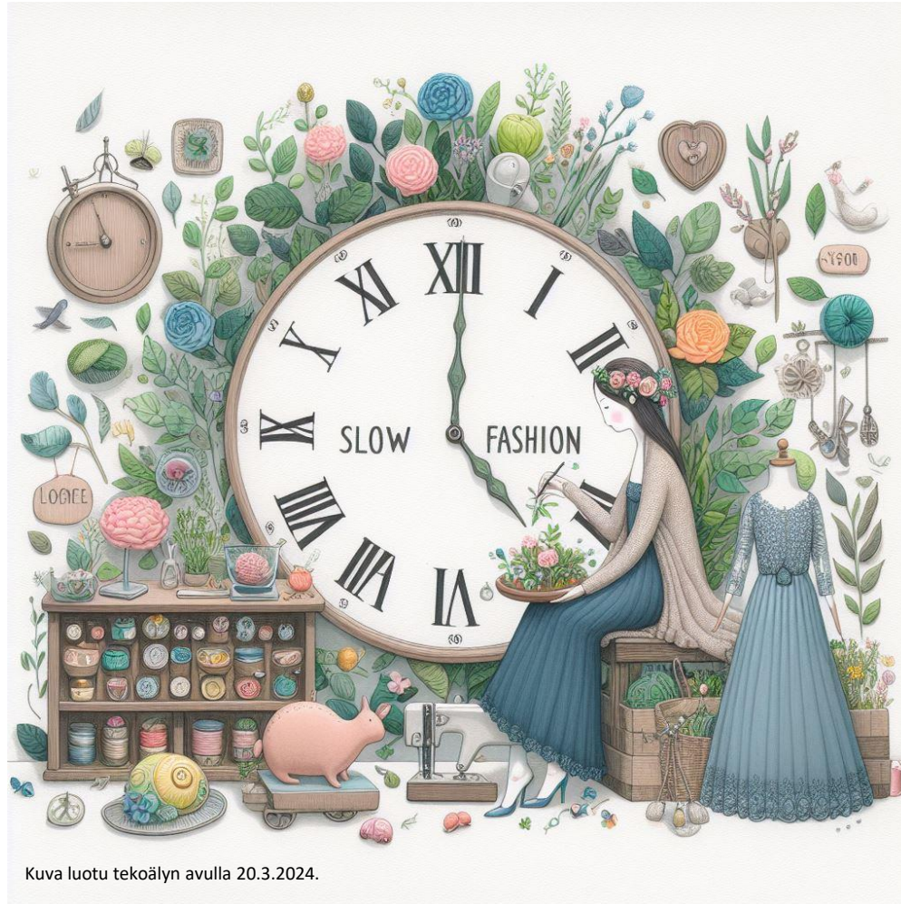
Kuva luotu tekoälyn avulla 20.3.2024.

Euroopan Unionin strategisia ehdotuksia ympäristövaikutusten vähentämiseksi ovat esimerkiksi