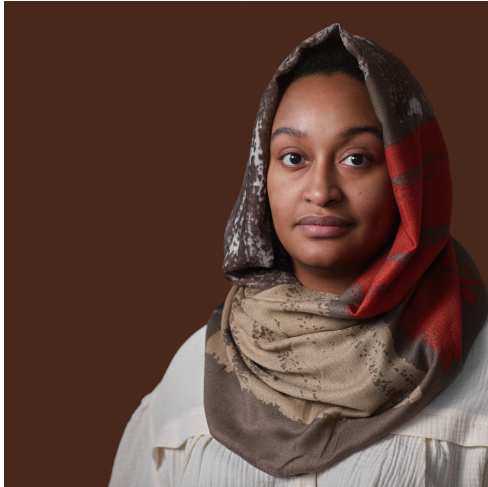
Illustrationsbild. Personen på bilden är inte Timiro.