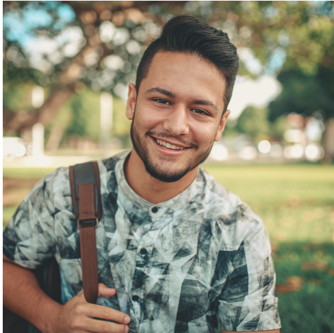
Illustrationsbild. Personen på bilden är inte Mohammed