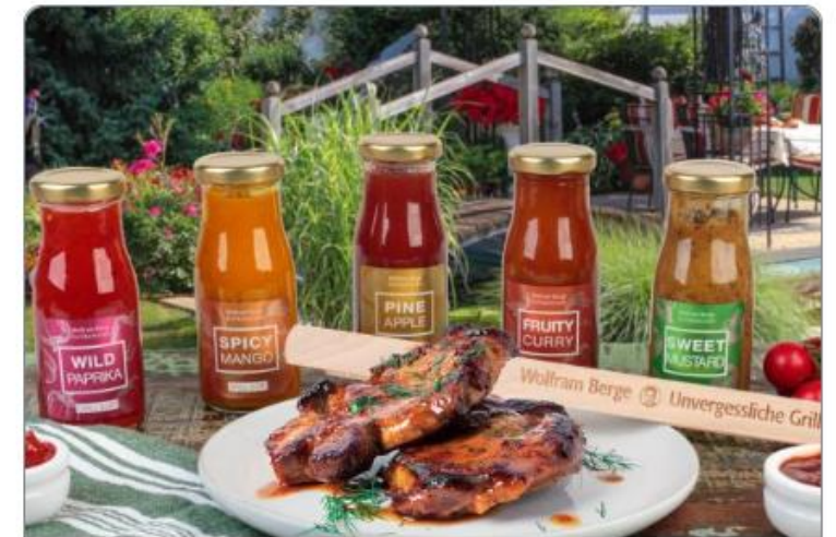
Gourmet-, Grillsaucen & Chutneys