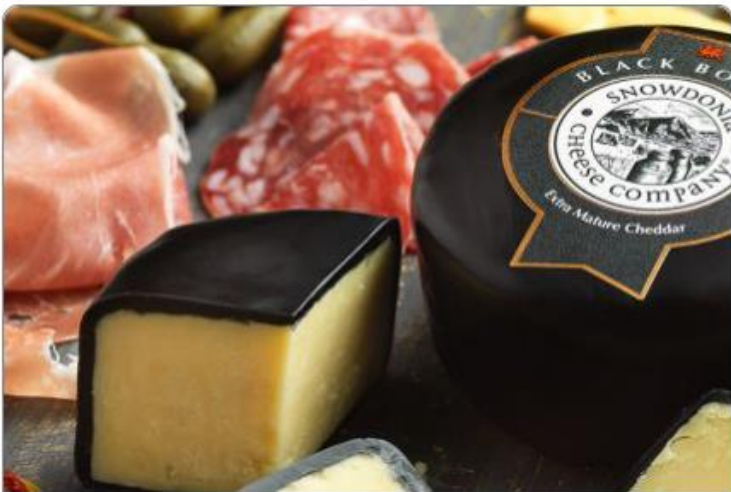
Käse & Wurst