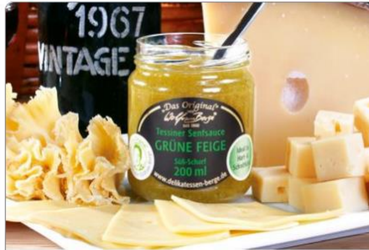
Original Tessiner Senfsaucen