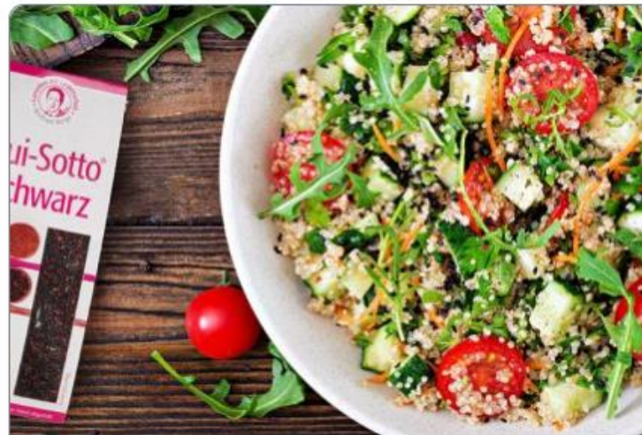
Pasta, Reis & Co.