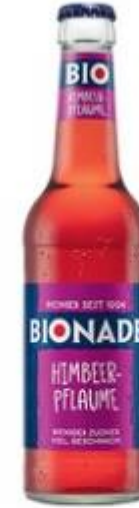
Bionade Himbeer-Pflaume 12x0,33L