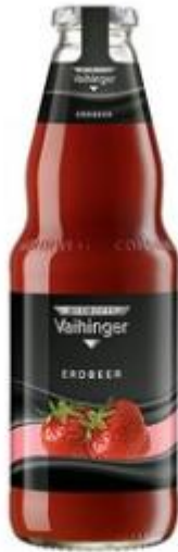
Vaihinger Erdbeer Nektar 6x1,0L