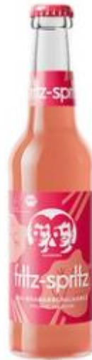
Fritz Spritz Bio-Rhabarberschorle 24x0,33L