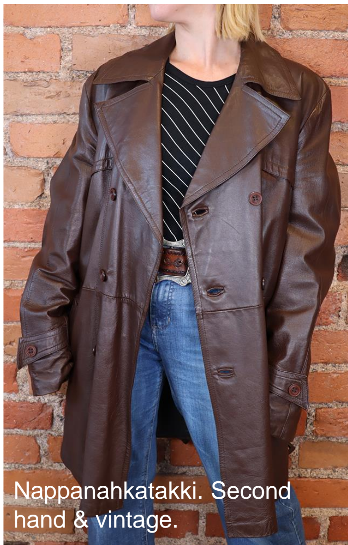
Nappanahkatakki. Second hand & vintage.