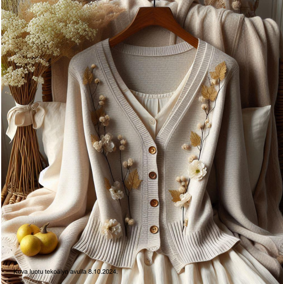
Kuva luotu tekoälyn avulla 8.10.2024.