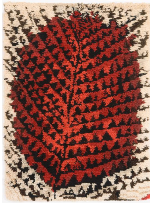
Metsässä palaa -ryijy