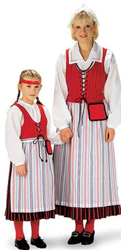
Kymenlaakso tarkistamaton hame - Suomen Perinnetekstiilit Oy (vuorelma.net)