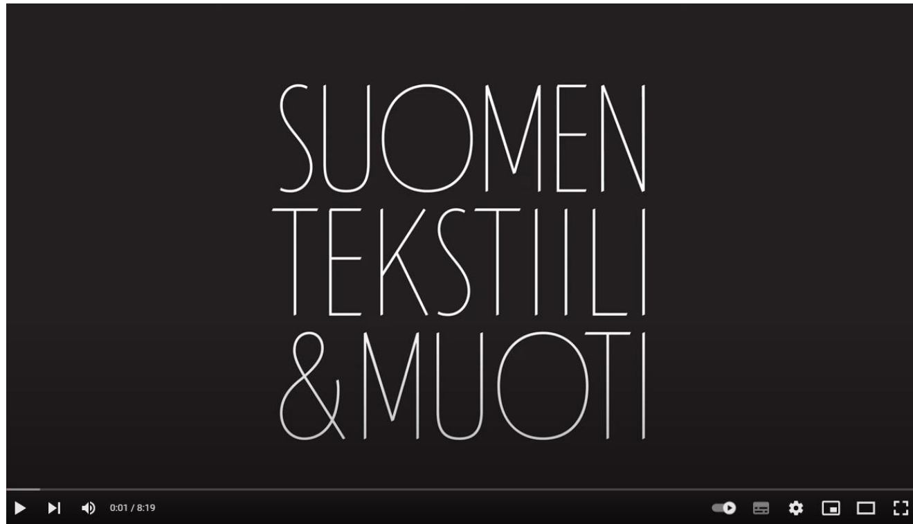
uomen Tekstiili & Muoti - 110 vuotta

Katso video Suomen tekstiiliteollisuuden historiasta.