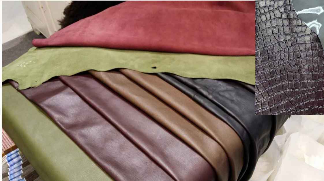
Lampaan vuotia – nappa ja mokka