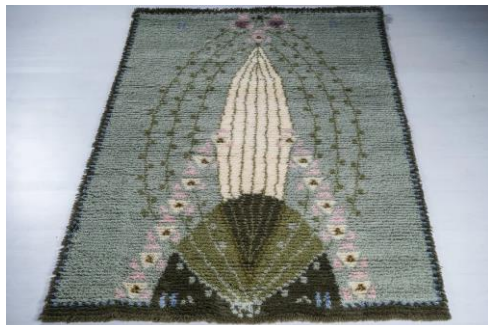
Eliel Saarisen suunnittelema ryijy 1200 € 1991.