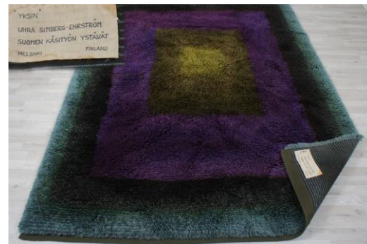
Uhra Simberg-Ehrnstöm, Yksin-ryijy 12 000€ 2013.