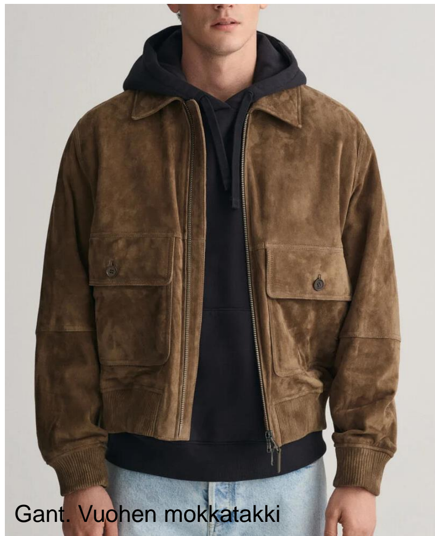
Gant. Vuohen mokkatakki