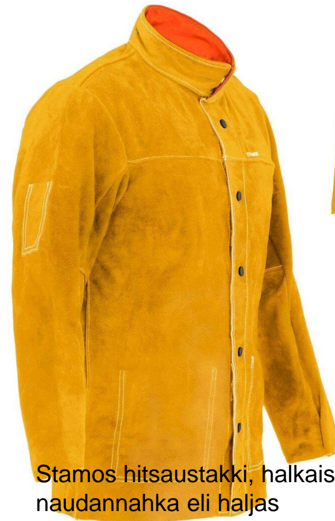
Stamos hitsaustakki, halkaistu naudannahka eli haljas

Paksut nahat voidaan halkaista, jolloin lihapuolelta saadaan haljasnahka .