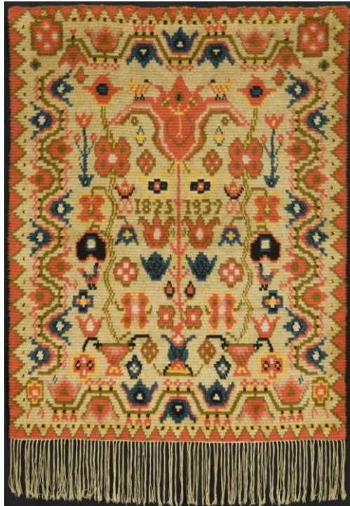
Porin tienoot -ryijy.