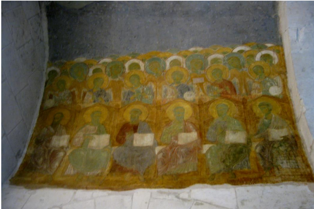
Фрески Рублёва в Успенском соборе во Владимире

С середины XVI в. иконопись подвергается влиянию западноевропейского изобразительного искусства. Развитая иконография икон придворной школы использует западноевропейские сюжетные схемы. Конец XVI – начало XVII веков ознаменовано развитием "строгановской школы" (которая, несмотря на название, также состояла в основном из придворных мастеров) отличающейся изысканностью цвета и внимательной проработкой деталей, тенденцией к некоторой декоративности и "красивости" живописи.