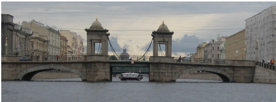
вский «Легенды и мифы Санкт-Петербурга»

(В) связи с п...р...стройкой Николаевского дворца мост п...реим...новили в Николаевский, а после революц... ему пр...своили имя Лейтенанта Шмидта.