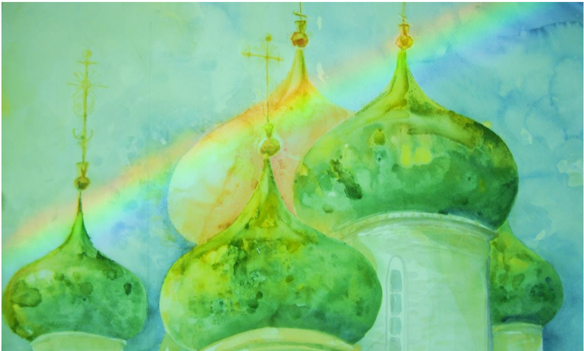
Tekijät ovat saaneet Cultura-säätiöltä 5000 euron apurahan Aurora-sarjan laatimiseen.