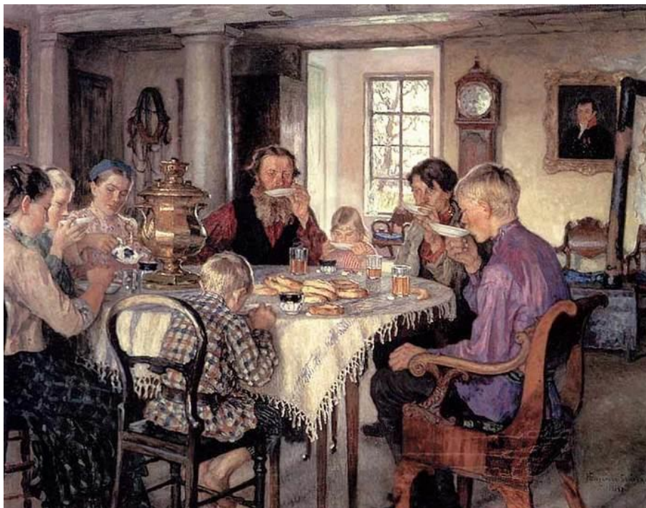
Н. Богданов-Бельский. Новые хозяева. Чашепитие. 1913