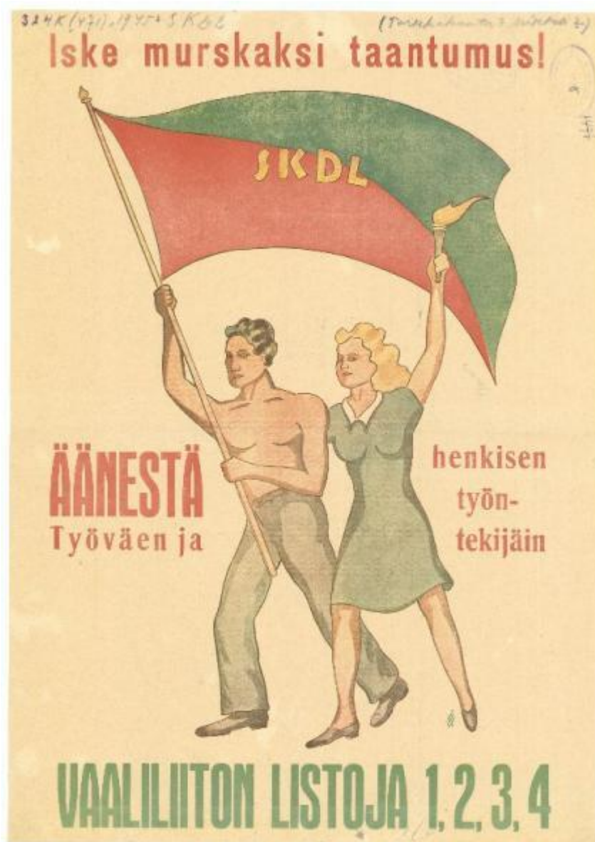
Bild 1: Kommunalval, 1945.