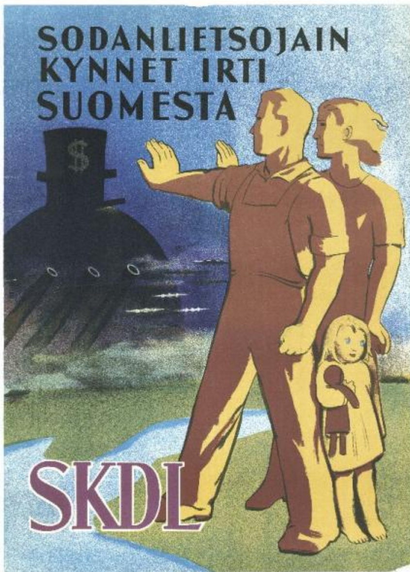
Bild 5: Riksdagsval, 1948. Tapio Tapiovaara. CC BY-NC-ND 4.0. Finna.fi: Länk till affisch

e) Vilka ansåg DFFF vara krigshetsare (sodanlietsoja) och vilka fredskrafter?