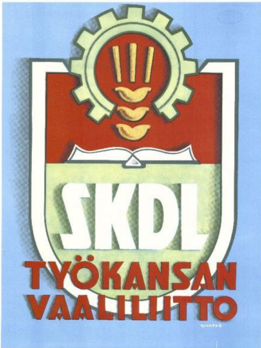
Bild 2: Valaffisch, 1948. CC BY-NC-ND 4.0. Finna.fi: Länk till affisch