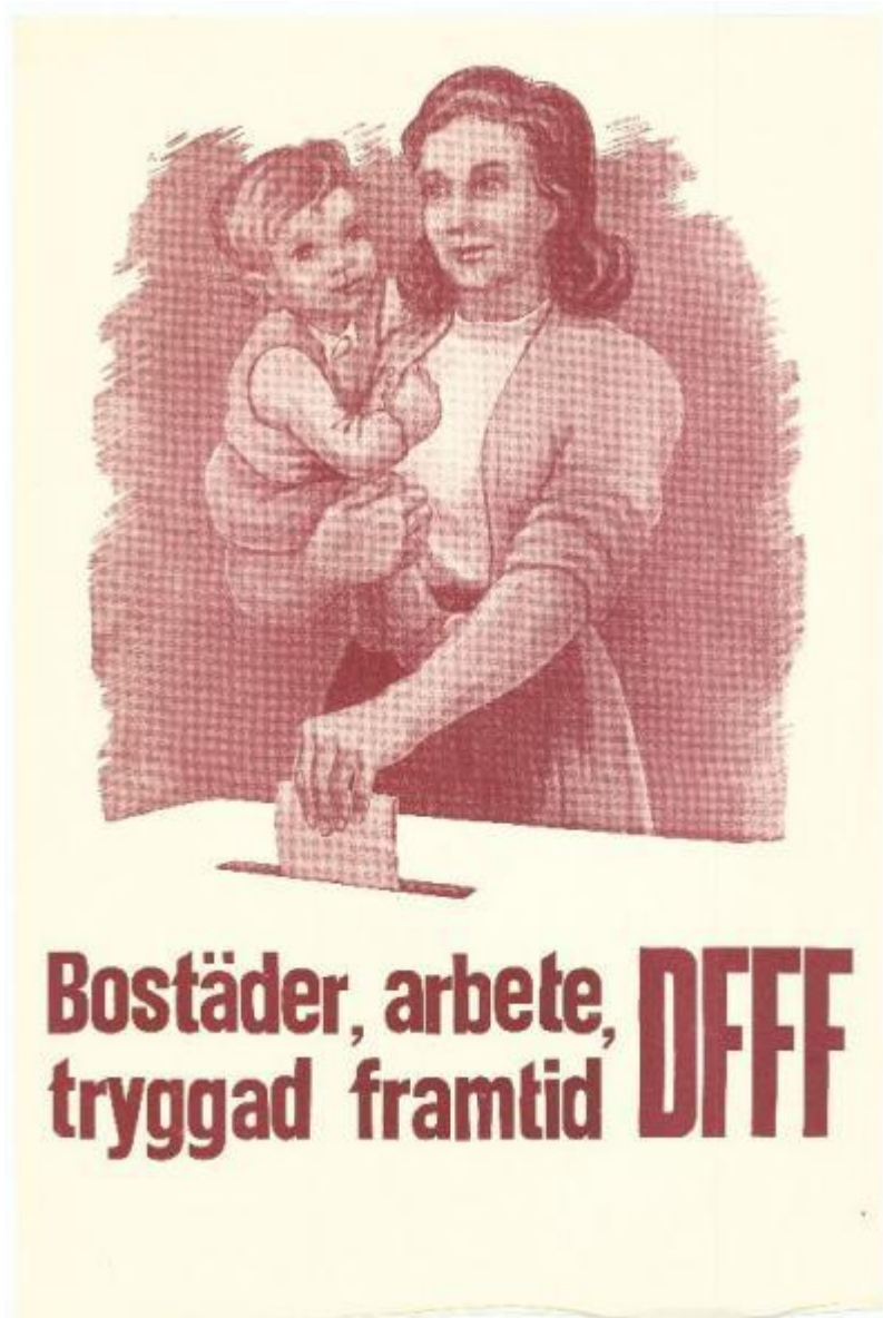
Bild 4: Kommunalval, 1953. Tapio Tapiovaara. CC BY-NC-ND 4.0. Finna.fi: Länk till affisch