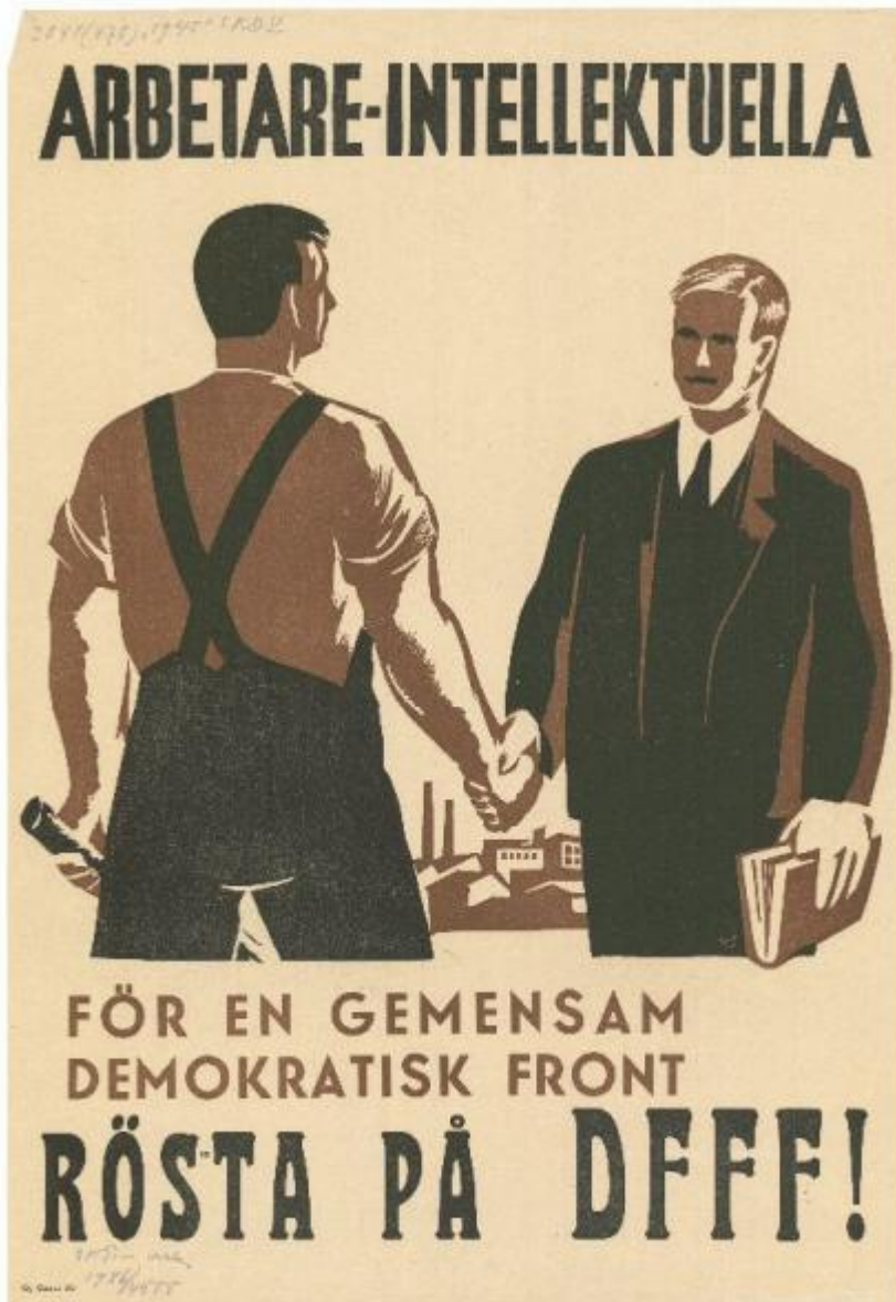
Bild 11: Kommunalval, 1945. CC BY-NC-ND 4.0. Finna.fi: Länk till affisch