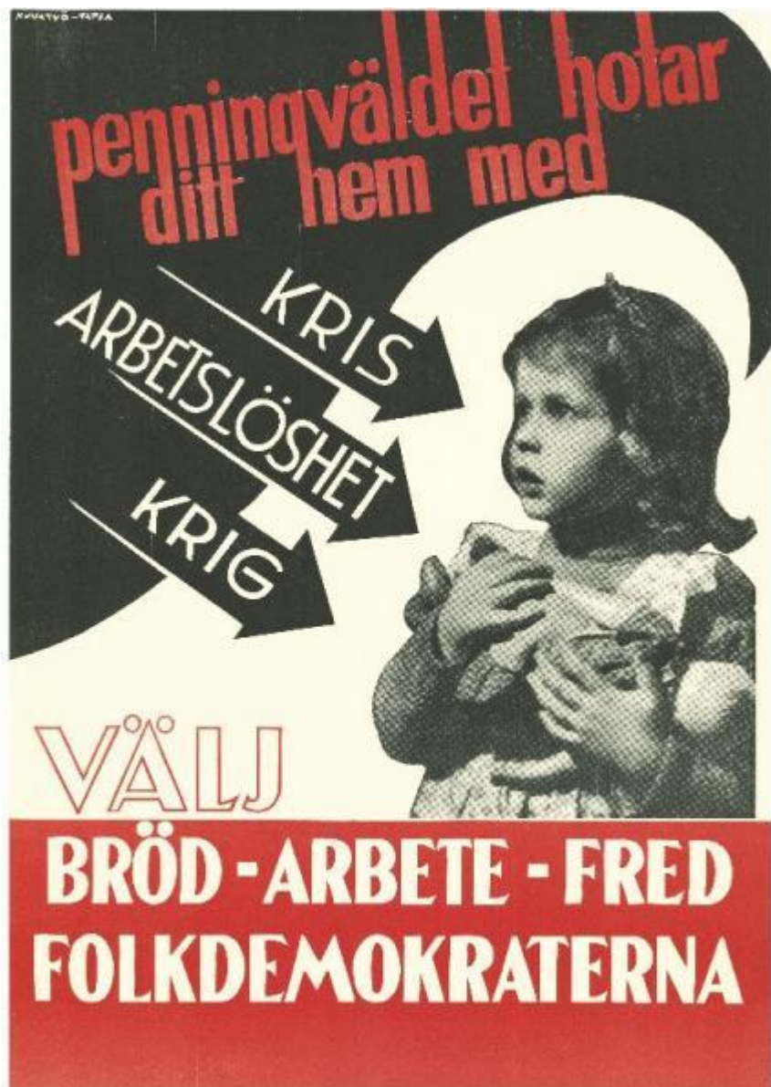
Bild 8: Presidentval, 1950. Tapio Tapiovaara. CC BY-NC-ND 4.0. Finna.fi: Länk till affisch