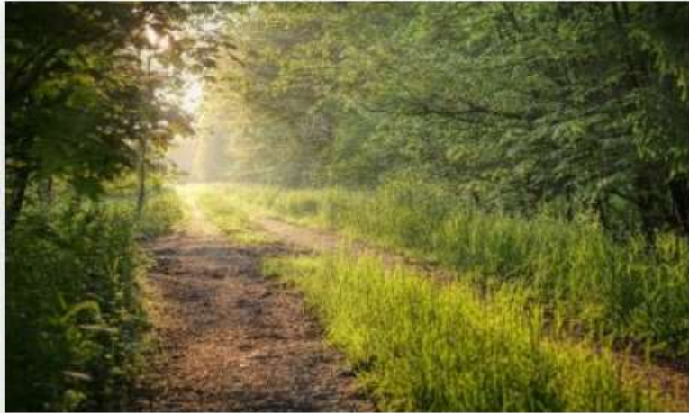
KANTA Fyysinen hyvinvointi Lyhytkoulutukset - teematarjotin

Hankkeen aikana rakennettiin itsenäisesti suoritettava verkkokurssi Salpauksen Elsa Moodle-oppimisympäristöön fyysisen hyvinvoinnin teemalla