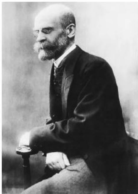
Émile Durkheim av okänd fotograf. Bilden är i public domain enligt Wikimedia Commons.

Émile Durkheim var verksam i Bourdeaux och Paris. Durkheim hade stort inflytande på senare sociologi i USA och Frankrike. I USA kom Durkheims sociologi att utvecklas i funktionalistisk riktning (Parsons, Merton) och i Frankrike i strukturalistisk riktning (Saussure).