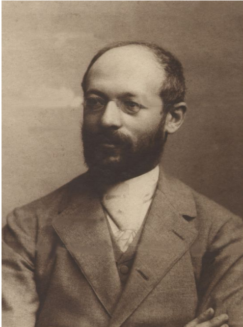
Georg Simmel.