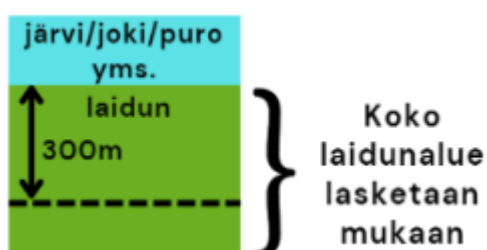
Kuvio 2. Esimerkkikuva ylhäältä päin laitumesta, jonka pinta-alasta yli 50 % on alle 300 m päässä vesistöstä