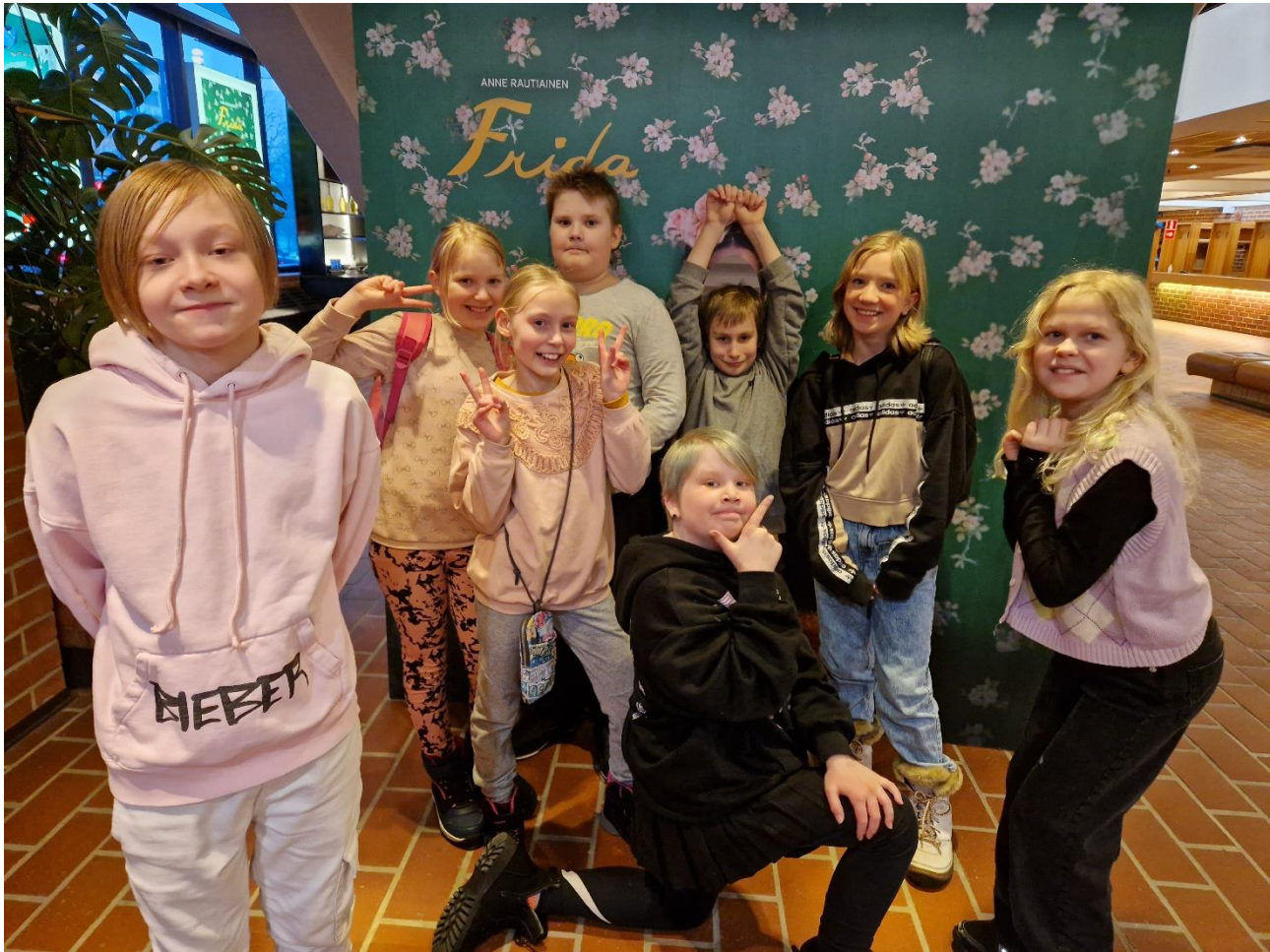
Kuva 2. Teatterikerho vierailulla TTT:n kulisseihiin.

loppuesitystä, joka sijoittuu kouluun. Tässäkin tapauksessa sovitusta ja repliikkejä työstetään ja ideoidaan ryhmässä.