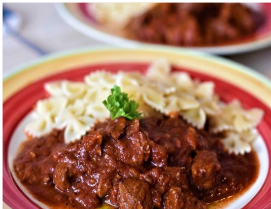
Köttträtter/M'ясні страви/ Мясные блюда