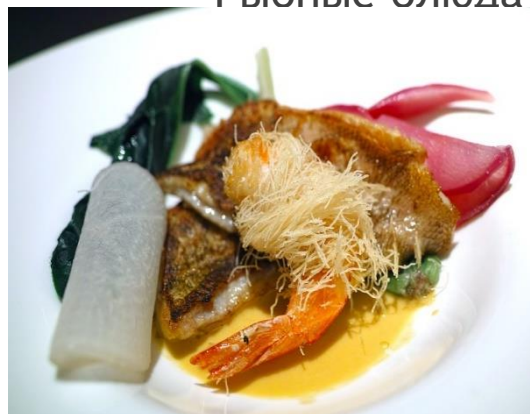
Fiskrätter/Рибні страви/ Рыбные блюда