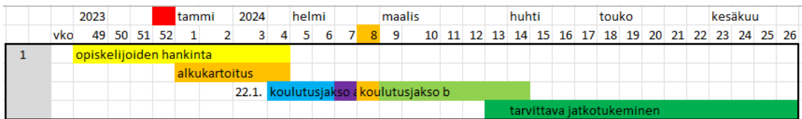
Kuva 1. Esimerkki ensimmäisen ryhmän koulutuksen aikataulusta.

Kuvassa 1. on esitetty gant -tyyppisesti yhden ryhmän aikataulutettu kokonaisuus. Hankkeen aikana neljä ryhmää toteutettiin aikataulullisesti samalla mallilla. Neljä ensimmäistä viikkoa oli lähiopetusta oppilaitoksen tiloissa ja seuraavat kahdeksan viikkoa työpaikalla oppimista yhteensä noin kolme kuukautta kestävässä koulutus- ja valmennuskokonaisuudessa.