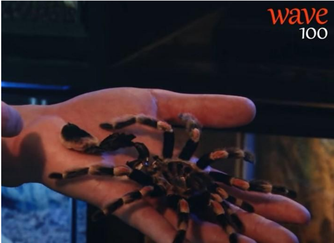
Kuva 1. Hämähäkki lemmikkinä -videon kuva.