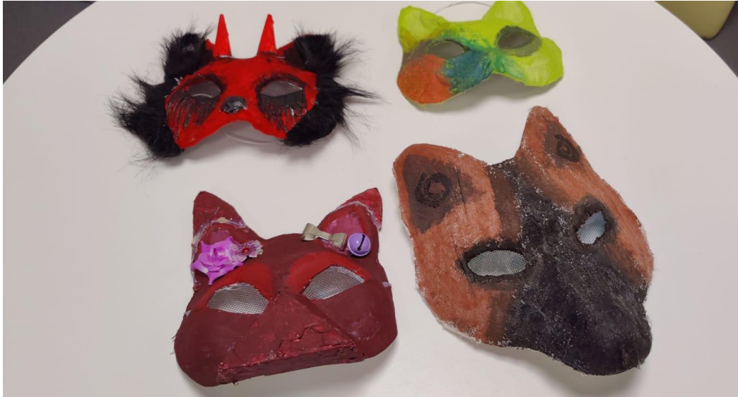
Kuva 2. Halloween naamareita. (Liisa Hyvärinen 2024)

ennen Halloween -juhlaa 1 kerhotunti, jolloin tehtiin naamareita. Kuvassa 2 on oppilaiden tekemiä naamareita.