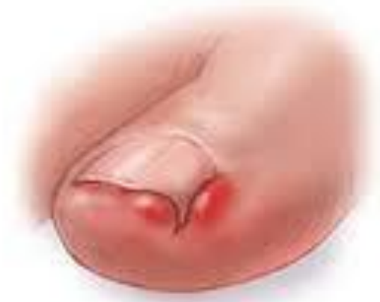
In-Grown Toe Nail