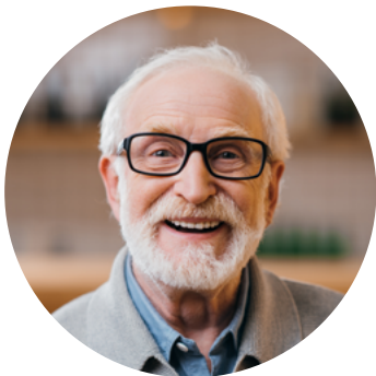
• virkeä = ei väsynyt