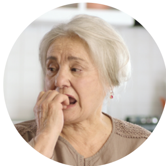
• levoton = ei rauhallinen