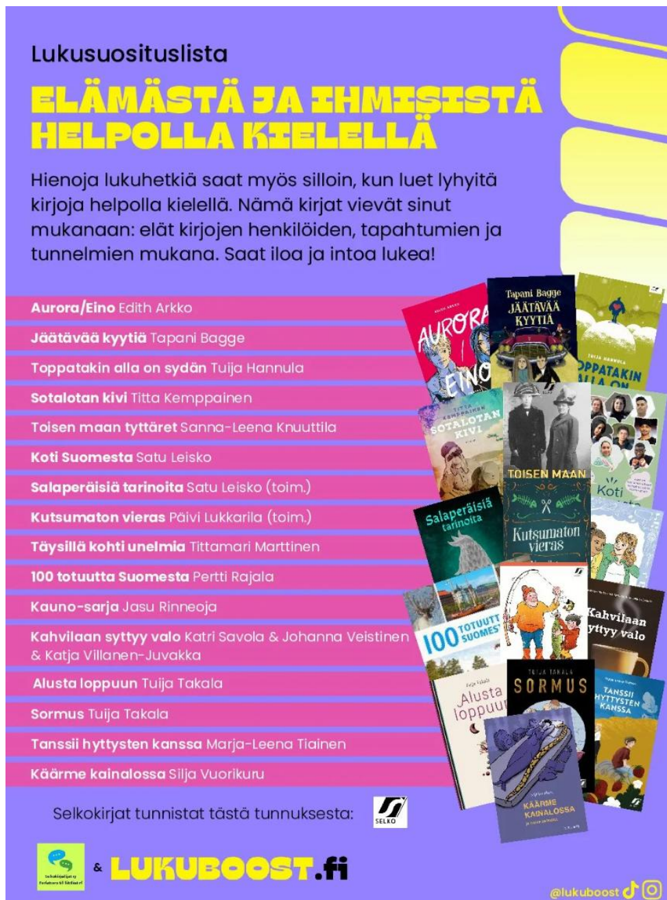
Kuva: Lukuboot-nettisivujen lukusuosituslistat.

jotka kirjailijat ovat kirjoittaneet suoraan selkokielelle.