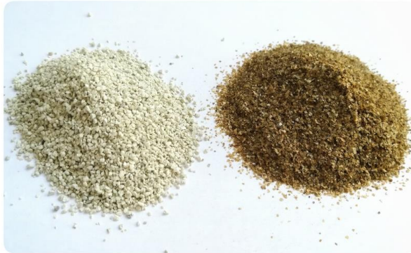
Kuva 1. Zeoliittia vasemmalla ja vermikuliittia oikealla.

Bentoniitin, biotiitin ja vermikuliitin rakenne on liuskeinen; liuskeiden väleissä on tilaa vedelle ja ioneille. Vermikuliittia myydään usein paisutettuna. Tällöin vermikuliitin rakenne on rikottu kuumentamalla vermikuliitti nopeasti hyvin korkeaan lämpötilaan, jolloin sen tilavuus on paisunut moninkertaiseksi, siitä on tullut ilmavampaa,