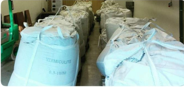
Kuva 2. Vermikuliittia suursäkeissä. Vermikuliitti lannan sekaan käytettynä vähentää typen haihtumista ja parantaa kasvien kasvua lannalla lannoitettaessa.

Mineraaleja voidaan lisätä myös eläinsuojiiin. Silikaattimineraalien tehoa on tutkittu, kun on haluttu vähentää kananlannan hajoamisesta johtuvaa ammoniakinhajua kanalassa. Tutkimuksessa havaittiin, että lisäämällä lantaan 2 % bentoniittia ja 1 % zeoliittia suhteessa lannan määrään, ilmaan haihtui 30 % vähemmän ammoniakkia kuin ilman lisäystä. 5