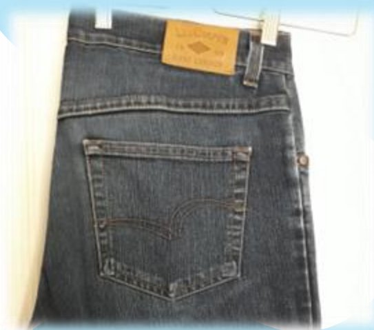
Oma vaatekaappi