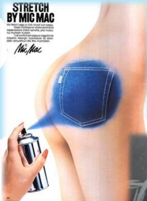
Esimerkki Mic Macin rohkeasta mainonnasta, jota kaikki lehdet eivät suostuneet julkaisemaan.