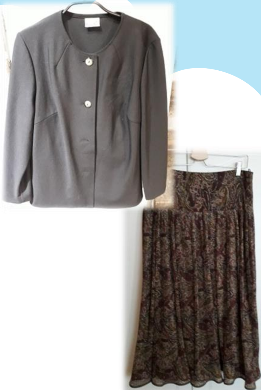
Kuva:Tiina Kajala, The Kirppis, oma vaatekaappi