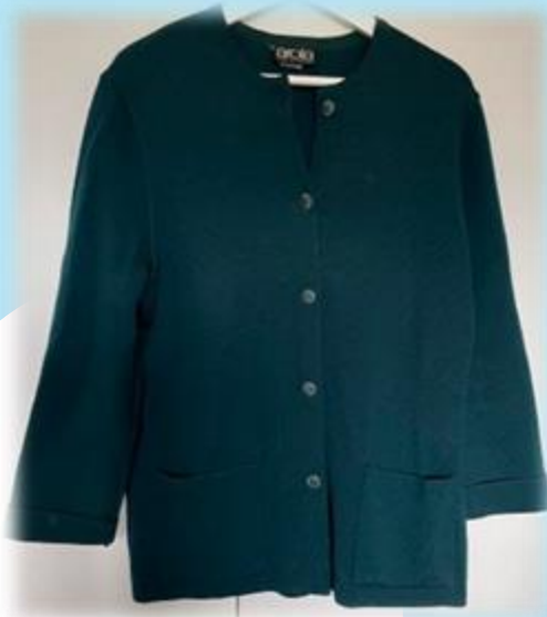
The Kirppis