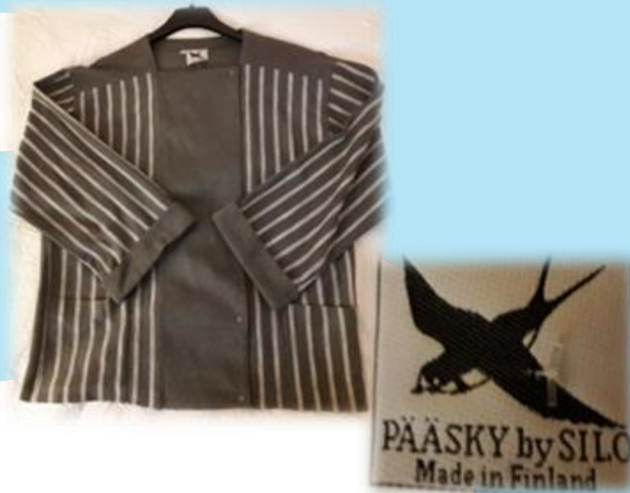
Oma vaatekaappi