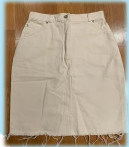
oma vaatekaappi