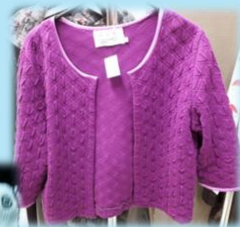
The Kirppis