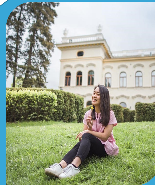
Tähän laitetaan kummiopiskelijan kuva