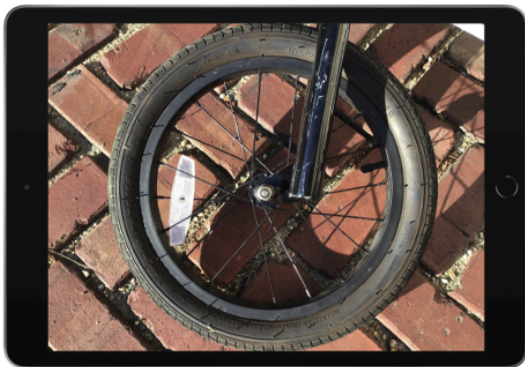
Kuvia, ääntä, videota

Kuvauskävely on hauska tapa tarkastella ympäristöämme ja sen yksityiskohtia. Kuvat voidaan järjestellä myöhemmin teema-albumeihin Kuvat-kirjastossa