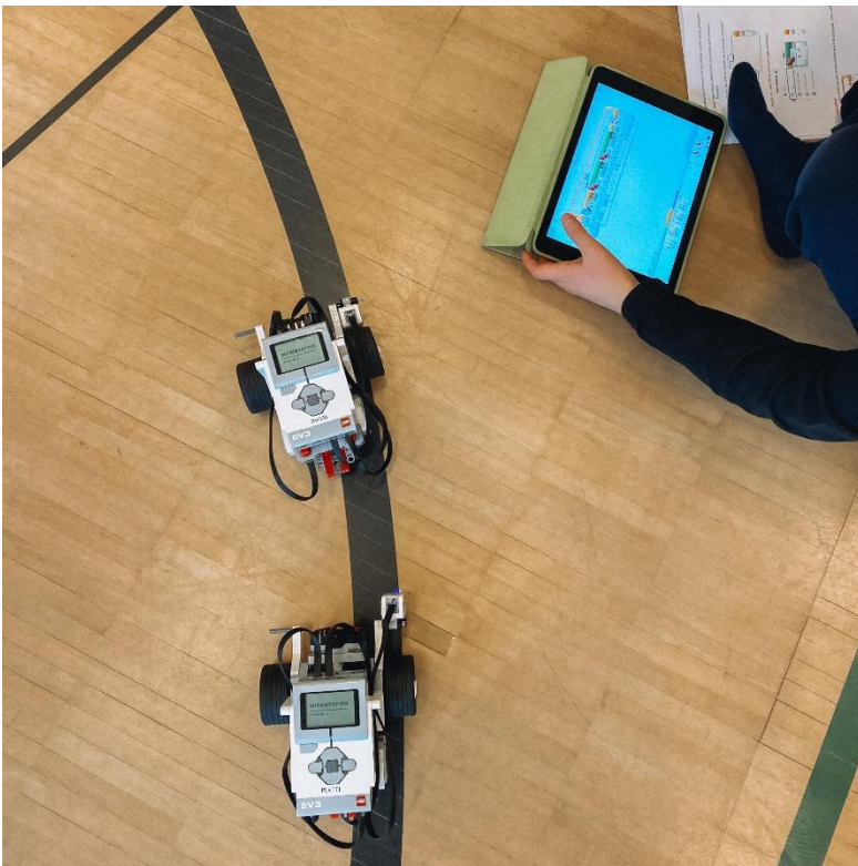
Kuva 4. Musta viivan seuraaminen valosensorin avulla. Kahden ryhmän robotit liikkumassa koulun juhlasalin lattialla.