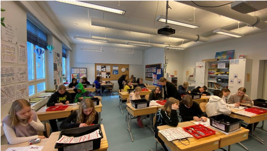
Kuva 1. LEGO-robotin rakentaminen