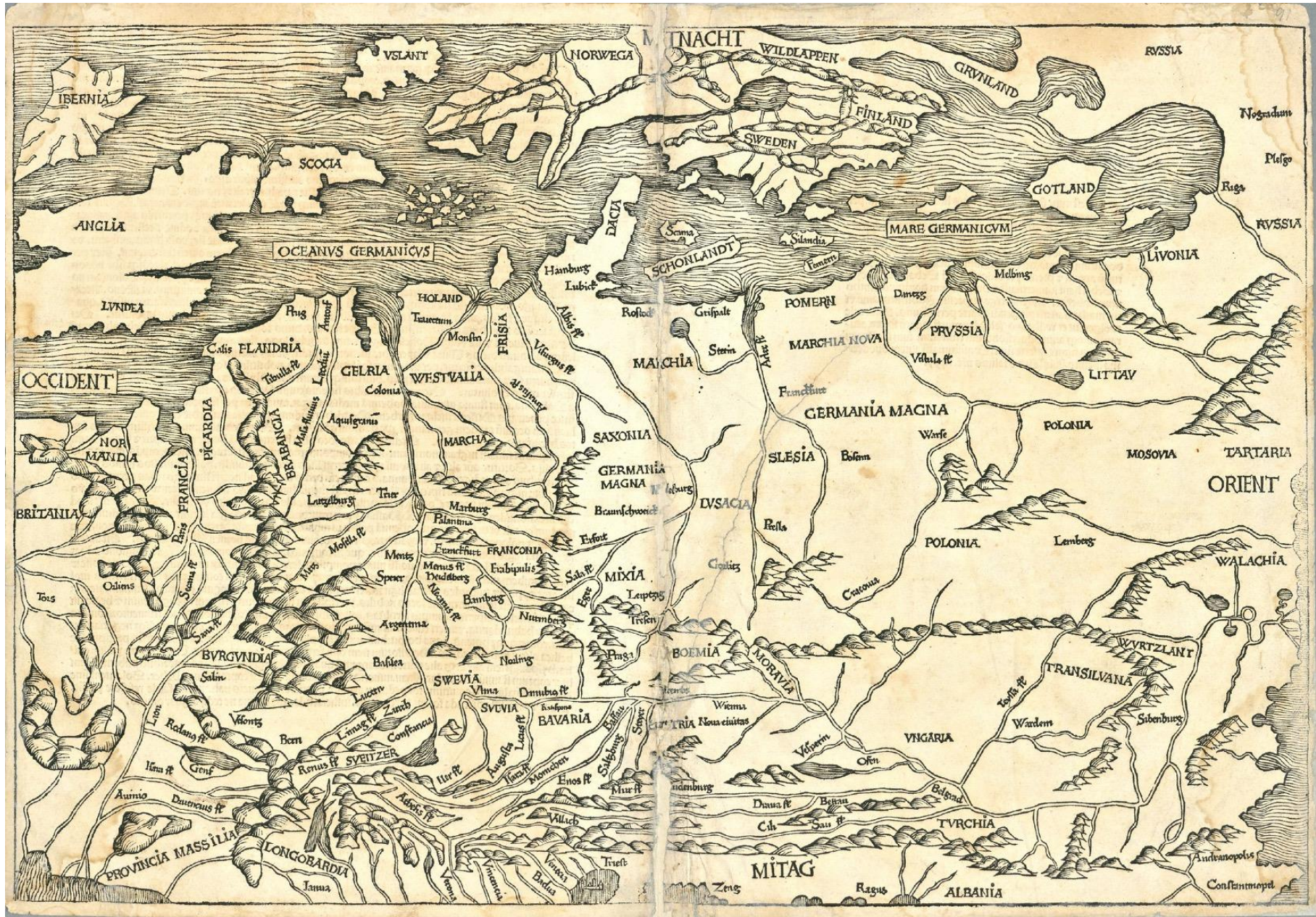
Bild 1: Europa centralis et septentrionalis. Münzer, Hieronymus. 1493. Nationalbiblioteket. Användarrätt till bilden Public domain. Finna.fi: Länk till sidan med bilden.