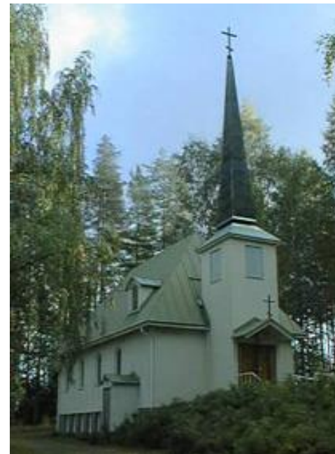
Suurmartyyri Georgios Voittajan kirkko, Siilinjärvi.

Siirtokarjalaisille evakkous tarkoitti myös sitä, ettei heidän uudessa ympäristössään ollut muita ortodokseja tai ortodokseille tarkoitettuja pyhäköitä. Tämän lisäksi evakkoon lähteminen merkitsi luovutettujen alueiden seurakuntien hajoamista sekä omaisuuden menettämistä. Jotta ortodoksisuutta pystyivät ylläpitämään uskontoaan, edellytyksenä oli saada sen harjoittamiselle ja uusien pyhäkköiden rakentamiselle rahoitusta. Kirkkokunnan jälleenrakennus säilyttäisi ortodoksisen kirkon aseman. Luterilaiseen maisemaan rakentaminen johti kuitenkin välttämättömään pyhäkköjen muuttumiseen ulkonäöllisesti.