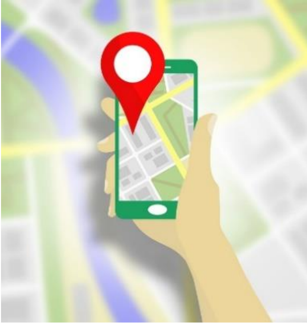
Kuva 5: Puhelimen GPS-paikannusta voidaan hyödyntää toiminnallisessa matematiikan opetuksessa.

Toiminnallinen tehtävä voi olla myös osana nuoren kauppareissua, jossa hänen täytyy valita neljä juotavaa, joiden sokeripitoisuuksia ja tilavuuksia hän kirjoittaa ylös. Tehtävänä on määrittää näiden juomien sokeripitoisuus. Tehtävän yhteydessä oppilaat ymmärtävät, miten paljon sokeria mehut ja energiajuomat sisältävät. Vaihtoehtoisesti tehtävän voi tehdä kotona etsimällä tuotteiden tietoja netistä. Tehtävän avulla oppilaat pääsevät harjoittelemaan prosenttilaskuja ja saavat valmiuksia esimerkiksi kemian tehtäviin, joissa selvitetään massa- ja tilavuusprosentteja.