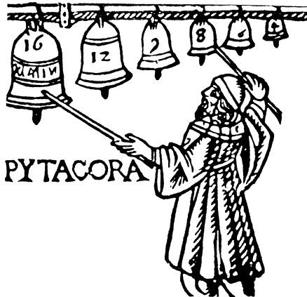
Kuva 3: Pythagoras tutkimassa erikokoisten kellojen tuottamaa ääntä.

määrä matemaattista sisältöä: murtoluvut, suhdeluvut, logaritmit ja lukujen monikerrat. Sen vuoksi käsittelemme seuraavaksi, miten matematiikka ja musiikki liittyvät toisiinsa, ja kuinka niiden avulla saadaan toiminnallinen matematiikan opetus.