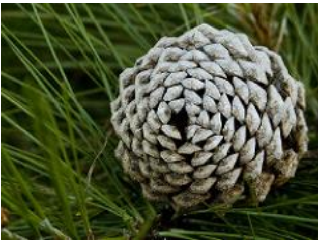
Kuva 2: Kävyen peitinsuomujen spiraalirakenteessa esiintyy Fibonaccin lukuja.

Toinen ulkona toteutettava toiminnallinen oppimiskokonaisuus on Luonnon arkkitehti (alkaa sivulta 182), jossa tutustutaan luonnossa esiintyvään ilmiöön, kerätään siitä tietoa ja mallinnetaan sitä matemaattisesti. Tässä tehtävässä oppilaat pääsevät ulos havainnoimaan ja mittaamaan kaatuneen puun tyveä ja oksia. He mittaavat muun muassa puun ja sen haarautumien pituutta, halkaisijaa tyvestä ja haarautumiskorkeuksien suhteita. Tarkoituksena on kerätä puusta mahdollisimman paljon tietoa. Tämän jälkeen toiminnallisuus siirtyy metsästä omaan luokkatilaan, jossa saatuja mittoja tutkitaan, ja etsitään niiden välisiä riippuvuuksia eli korrelaatiota piirtämällä ja laskemalla. Piirtämiseen ja laskemiseen kannattaa käyttää taulukkolaskentaohjelmaa, jolloin oppilaiden tieto- ja viestintäteknologian käyttötaidot kehittyvät.