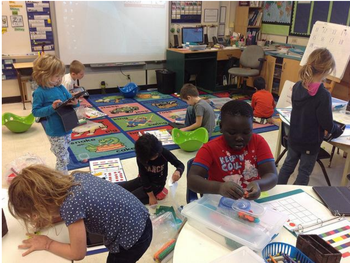
Kuva 2: Erilaisia toimintakeinoja

Oppimisen kannalta toimintakeinot voivat olla yhtä tärkeitä kuin toiminnan tavoitteet.