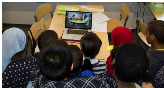
Kuva 2. Ensiesitys työpajan päätteeksi

Suurin osa työpajoista on ollut intensiivisiä, kahden päivän mittaisia kokonaisuuksia. Kohtaamisista osallistujien kanssa ovat lyhyitä. Usein en ole valitettavasti päässyt seuraamaan näiden lasten tai nuoren kehittymistä pidemmällä aikavälillä. Toisaalta suora kouluopetuksen lomaan sijoitetut työpajat tai toiminta tietyille ryhmille järjestetyillä leireillä on mahdollistanut sen, että kaikki pääsevät mukaan. Näin olemme tarjoneet toimintaa myös niille, jotka eivät yleensä osallistu taidekerhoihin