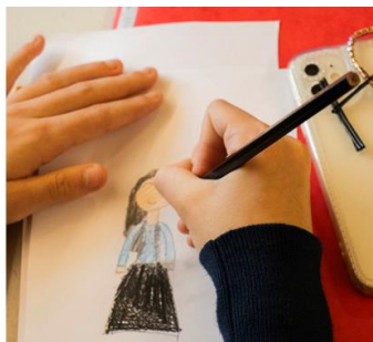
Kuva 1. Romani animaation sankarina (Kantola)

Pitkä työhistoriani sisältää lastenkulttuuria, media- ja taidekasvatusta, kulttuurihyvinvointia sekä kulttuurista moninaisuutta. Työvuosiin mahtuu useiden järjestöjen ja YLE:n palkkalistoilla erilaisten, päivästä viikkoon kestävien media- ja elokuvatyöpajojen järjestäminen ympäri Suomea. Lisäksi olen suunnitellut ja ohjannut kuukausia ja vuosia kestäviä taidekerhoja ja viikonlopusta viikkoon kestäviä leirejä. Useat, eri mittaiset kokonaisuudet on näiden vuosien aikana suunnattu erityis- tai vähemmistöryhmille. Ajatuksena tässä on ollut antaa mediatoiminnan kautta ääni myös heille, jotka yleensä jäävät vähemmälle huomiolle.