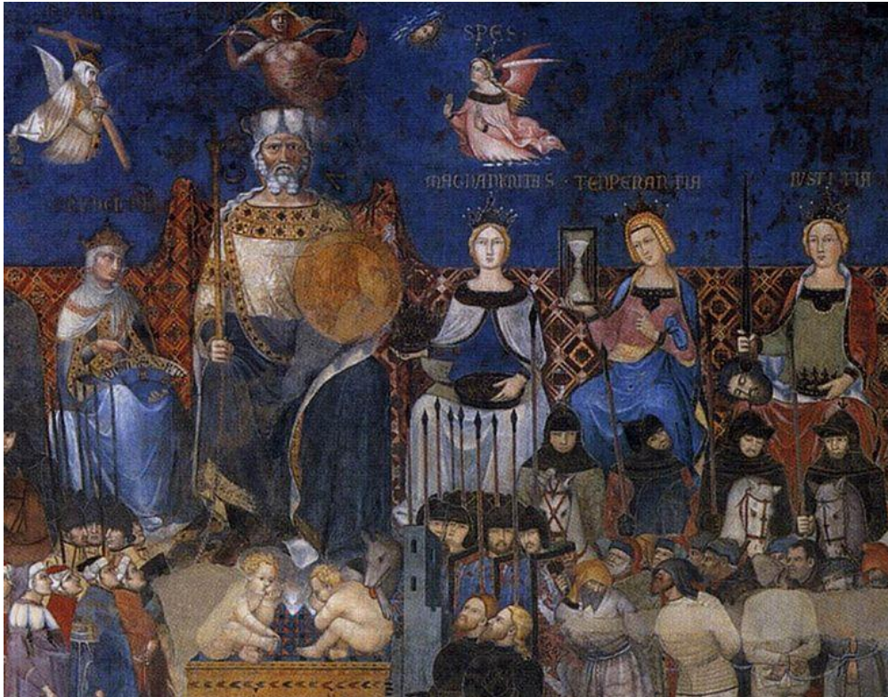
Ambrogio Lorenzettin fresko "Allegoria hyvästä hallinnosta" Palazzo Pubblicon salissa, n. 1339, Siena.

Sienan kaupunkitasavallan Palazzo Pubblico rakennettiin 1300-luvun alkupuolella. Sen salien seiniltä löytyvät edelleen Ambrogio Lorenzettin kuuluisa freskojen sarja "Allegoria hyvästä hallinnosta". Mitä hyveitä ja paheita ja niiden vaikutuksia voi tunnistaa freskoista?