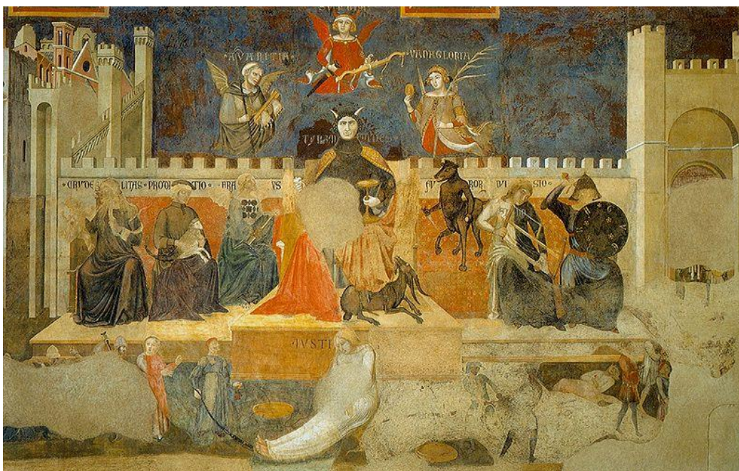
Ambrogio Lorenzettin fresko "Allegoria huonosta hallinnosta" Palazzo Pubblicon salissa, n. 1339, Siena.