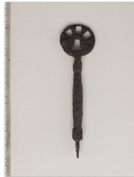
Kuvaaja tuntematon, Museovirasto, Arkeologian esinekeräily. Kuvan käyttöoikeus CC BY 4.0. Finna.fi: Linkki esineen sivulle