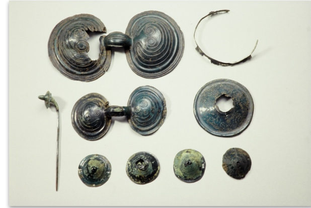
Kuvaaja tuntematon, Museovirasto, Arkeologian esinekokoelma. Kuvan käyttöoikeus CC BY 4.0. Finna.fi: Linkki esineen sivuille