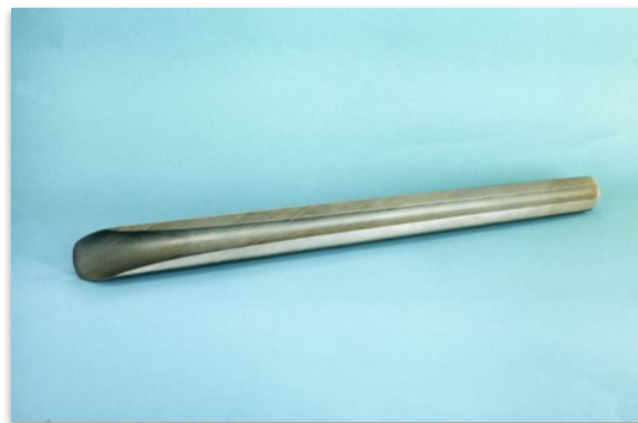
Kuvaaja tuntematon, Museovirasto, Arkeologian esinekokoelma. Kuvan käyttöoikeus CC BY 4.0. Finna.fi: Linkki esineen sivuille