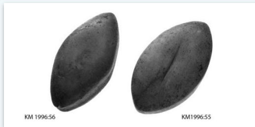
Kuvaaja tuntematon, Museovirasto, Arkeologian esinekokoelma. Kuvan käyttöoikeus CC BY 4.0. Finna.fi: Linkki esineen sivulle