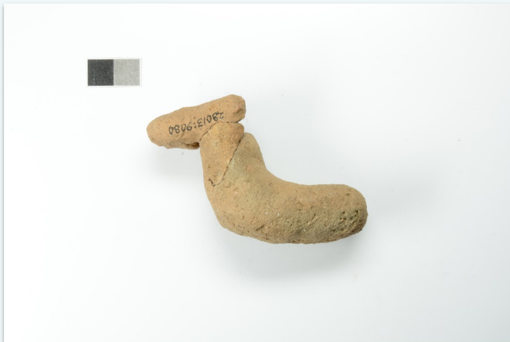
Kuvaaja tuntematon, Museovirasto, Arkeologian esinekokoelma. Kuvan käyttöoikeus CC BY 4.0. Finna.fi: Linkki esineen sivulle