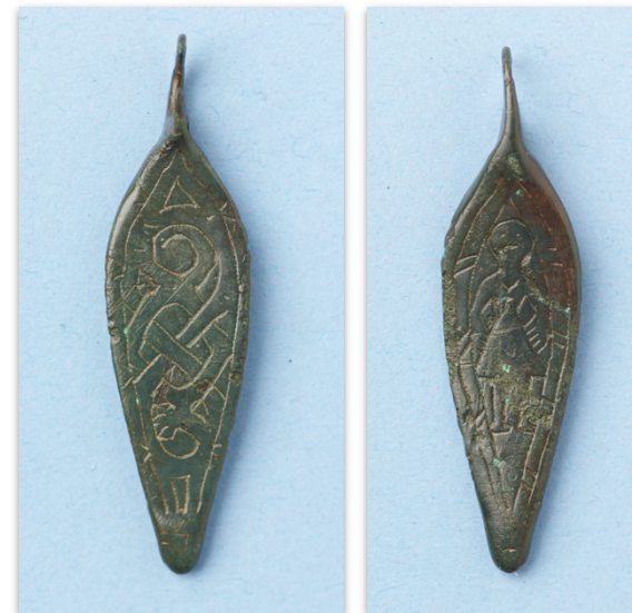
Kuvaaja tuntematon, Museovirasto, Arkeologian esinekokoelma. Kuvan käyttöoikeus CC BY 4.0. Finna.fi: Linkki esineen sivulle