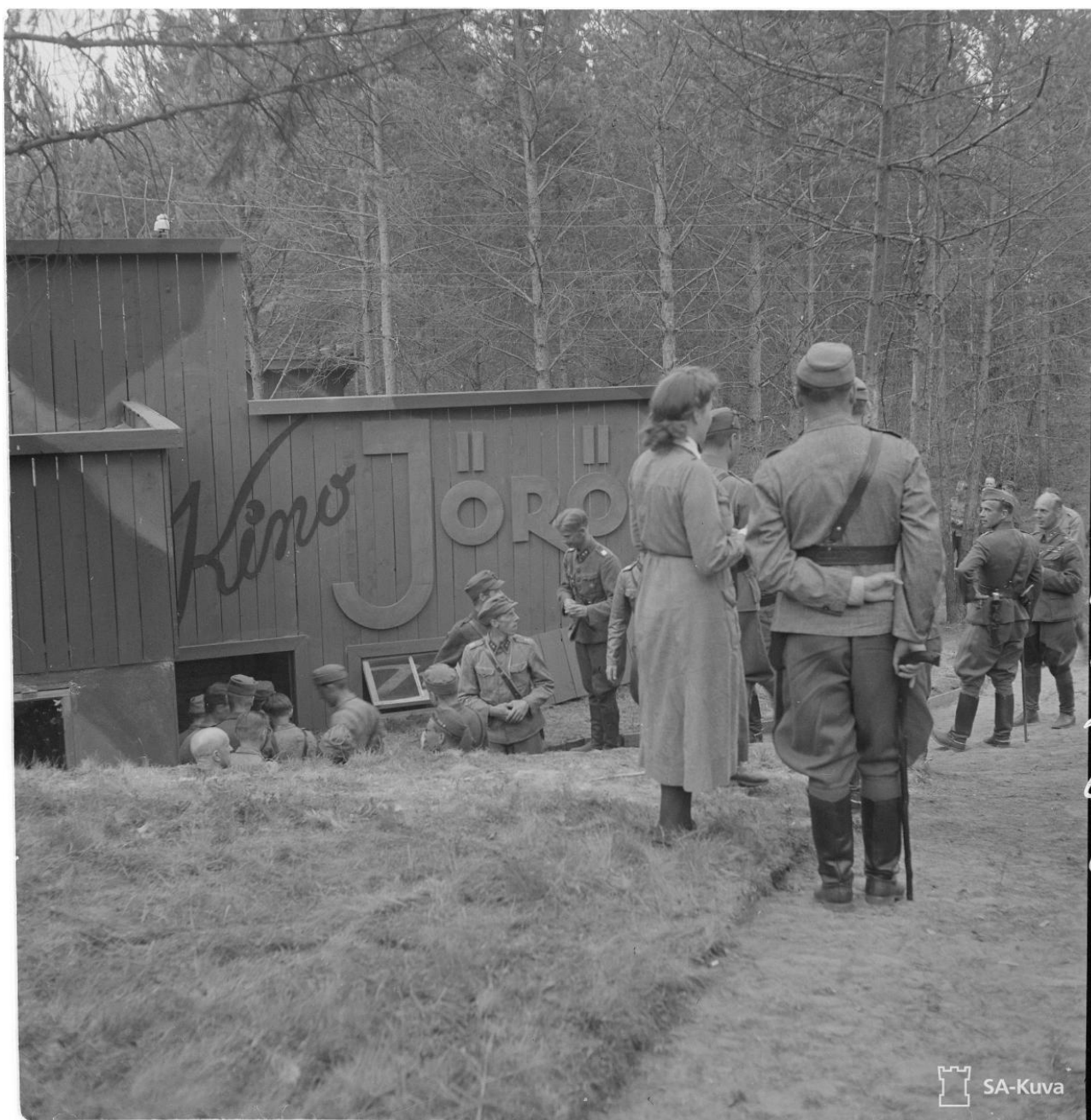
Kuva 1 Lempaalassa on avattu uusi elokuvateatteri Kino Jörö. Kuvaaja sot.virk. G. Feldhoff, Sotamuseo. 4.6.1943. Kuvan käyttöoikeus CC BY 4.0. Finna.fi: Linkki kuvan sivulle.