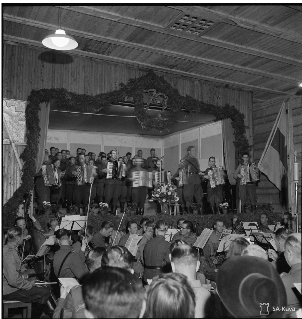
Kuva 2 72. Asemiesilta etulinjassa. Harmonikkapartio ja kuoro esiintyy. Kuvaaja luutnantti R. Ruponen, Sotamuseo. 2.9.1943. Aineiston käyttöehto CC BY 4.0. Finna.fi: Linkki kuvan sivulle.