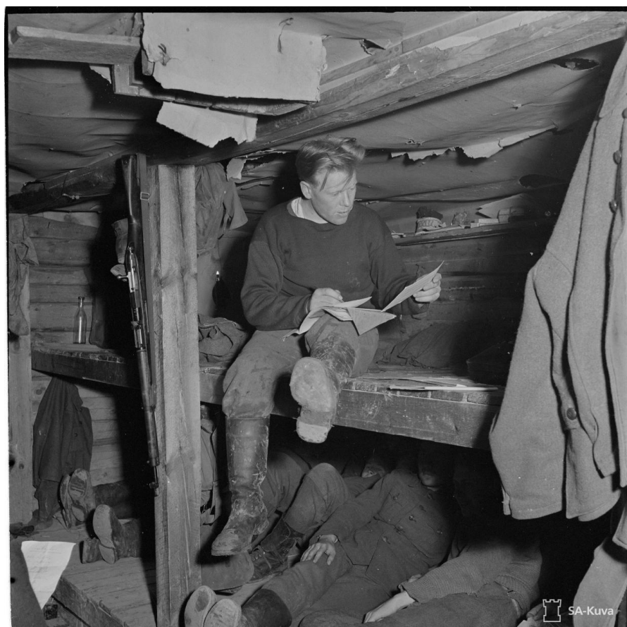
Kuva 5 Kirjeopiskelua harrastetaan Kannaksella laajassa mitassa. 27.4.1943. Kuvan käyttöoikeus CC BY 4.0. Finna.fi: Linkki kuvan sivulle.