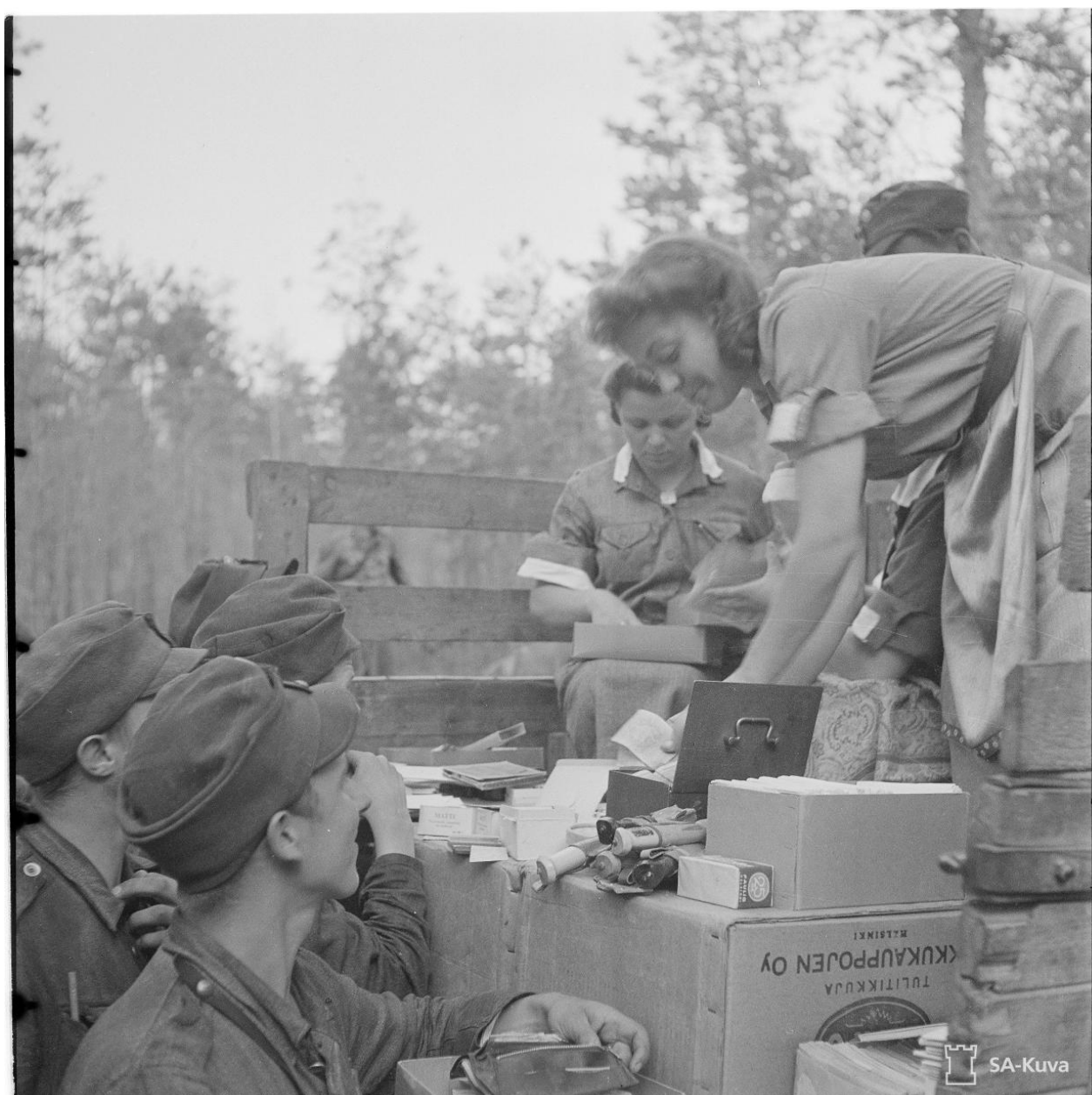
Kuva 6 Lotta-kanttiini käy etulinjan poikia viihdyttämässä.