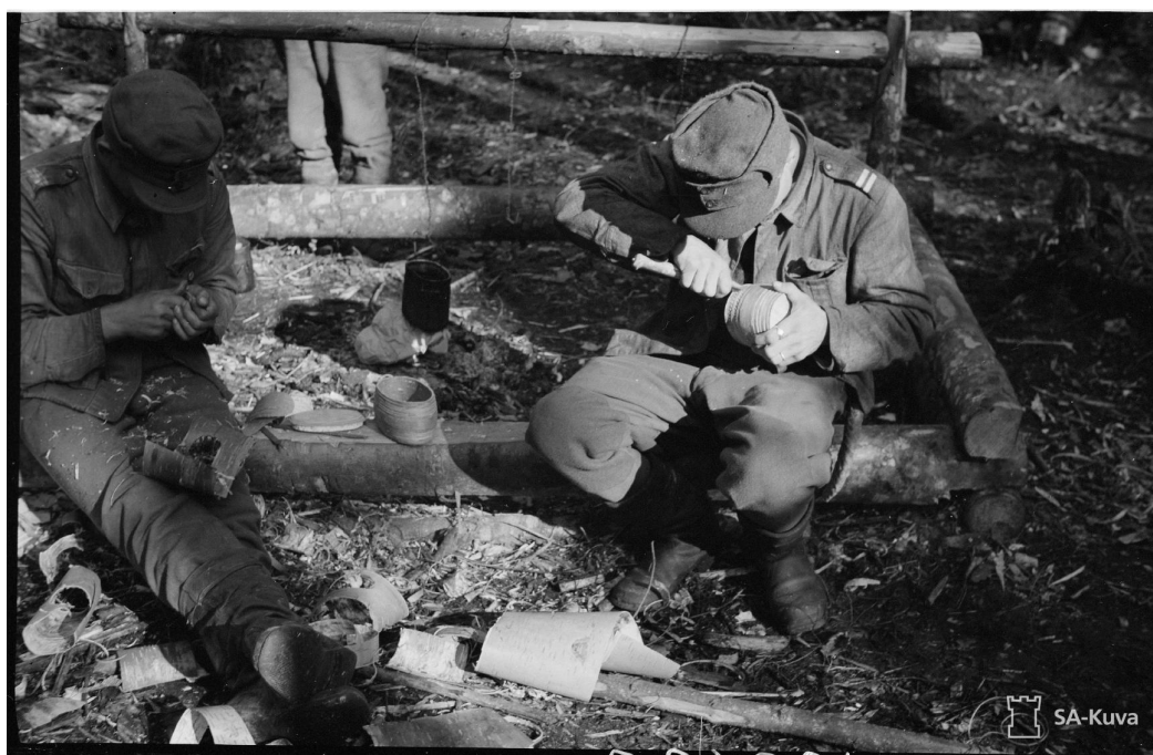
Kuva 3 Puhdetöitä tehdään etulinjoilla. Tuohesta tehdään voiaستioita. 28.8.1942. Kuvan käyttöoikeus CC BY 4.0. Finna.fi: Linkki kuvan sivulle.