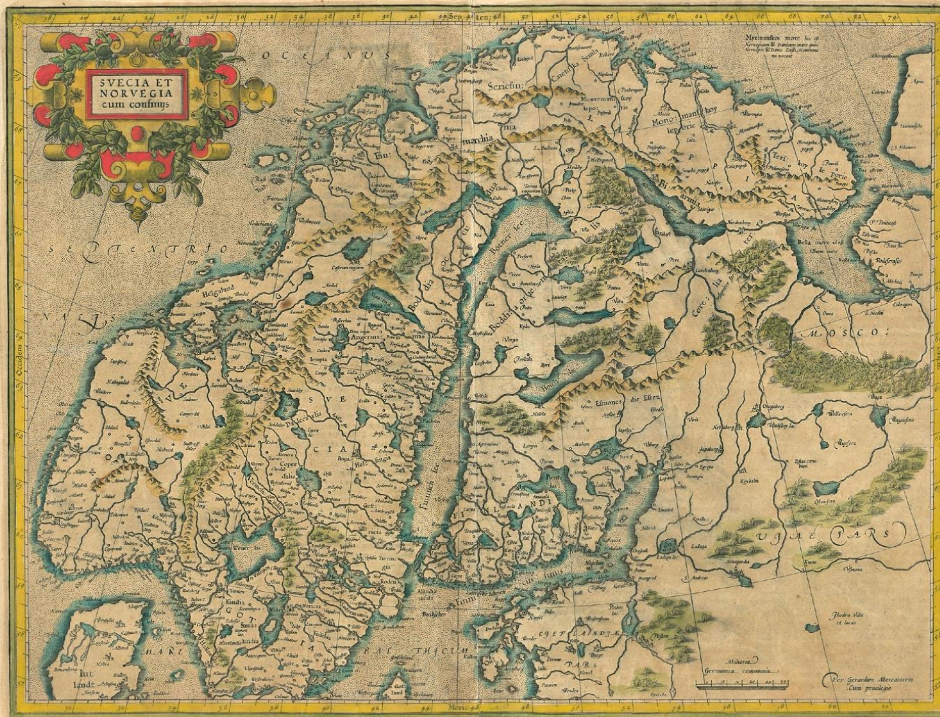
Kuva 3: Svecia et Norvegia cum confinijs. Mercator, Gerardus; Hondius, Jodocus. 1635.