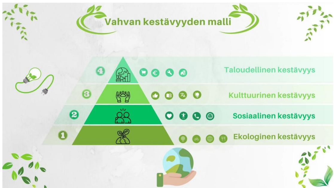
Kuva 3. Vahvan kestävyden malli, kestävä kehityksen ulottuvuudet (A.W-P. Canva)

Monet ympäristöteot ovat myös hyviä terveydelle. Esimerkiksi kasvispainotteinen ruokavalio ja hyötyliikunta tukevat ympäristöä ja omaa hyvinvointia. Tässä mallissa kakun alin kerros eli ekologinen kestävyys on tärkein.