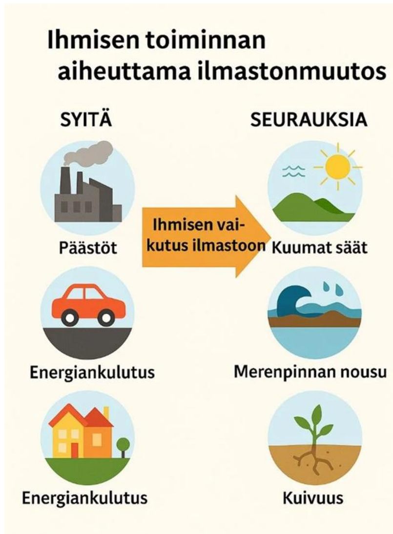
Kuva 1. Ihmisen toiminnan aiheuttama ilmastonmuutos (A.W.-P. ChatGPT)

Linkistä pääset kuvaan, jossa on lisää tietoja, miten ihminen vaikuttaa ilmastoon. Lue siis linkistä syyt ja seuraukset.