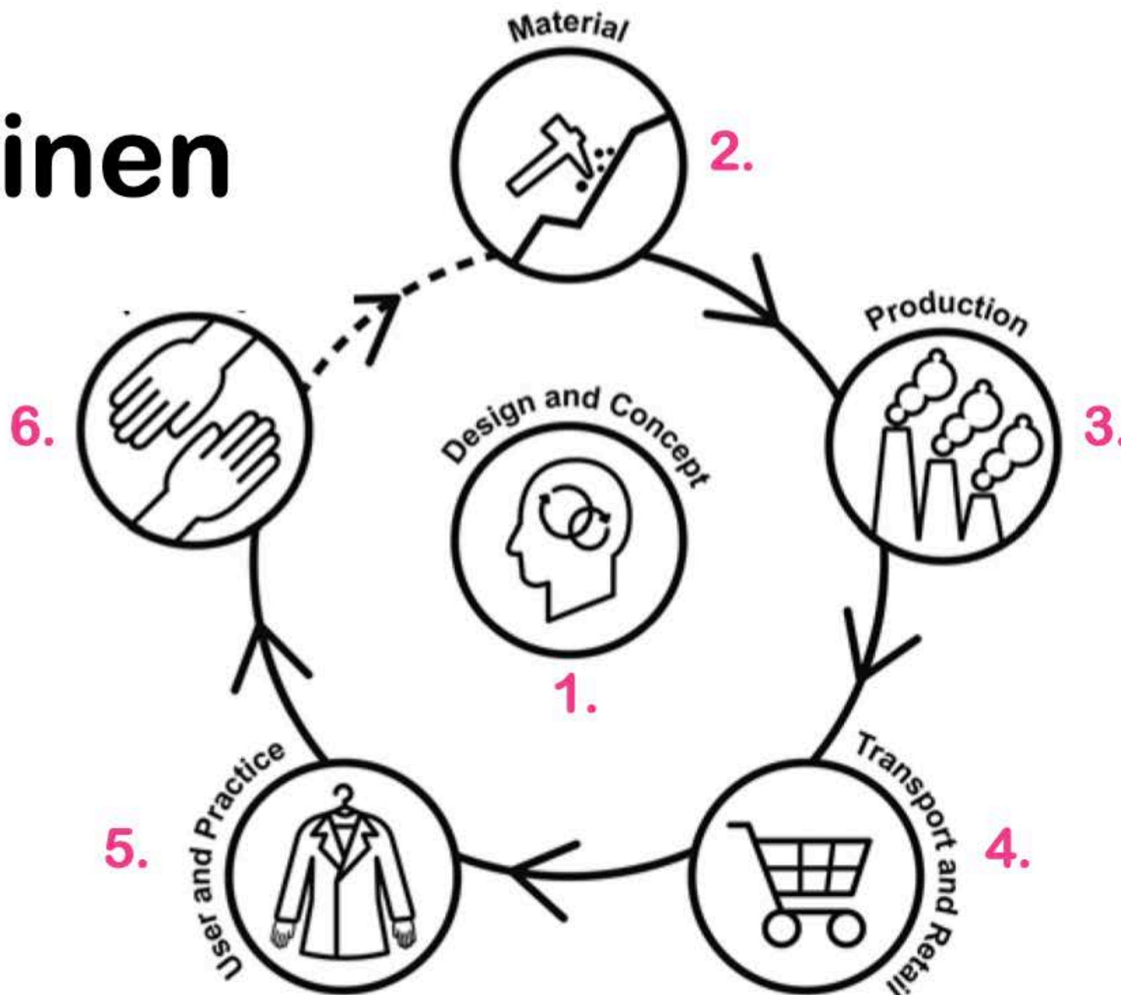
Kaavio 2: Ræbild & Hasling (2017). Lisäykset: Pakarinen 2025.