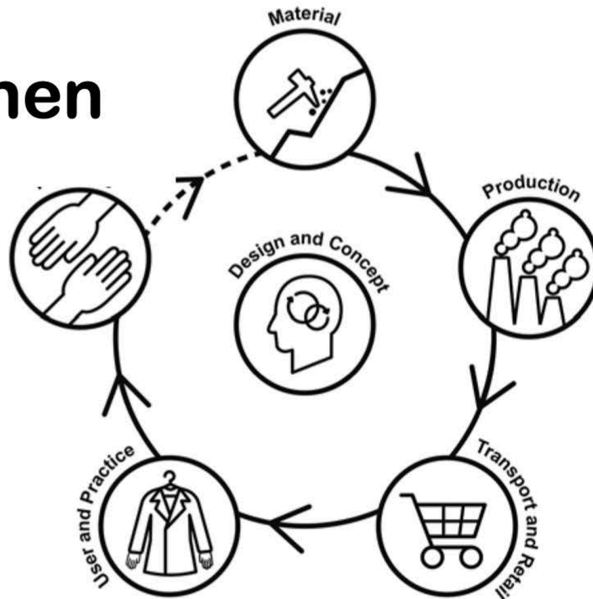
Kaavio 2: Ræbild & Hasling (2017)

(Vert. Design Forum Finland & Tikka 2024, 58-75)