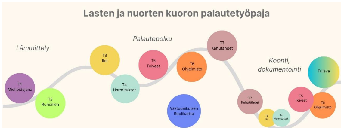
Kuva 1. Palautetyöpajan osiot ja tehtävät (Emilia Soranta 2024)