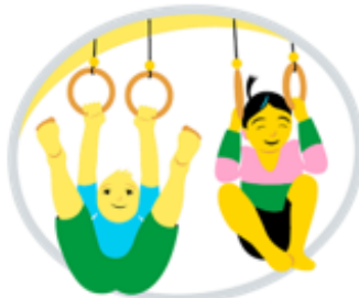
Jag växer, rör på mig och utvecklas