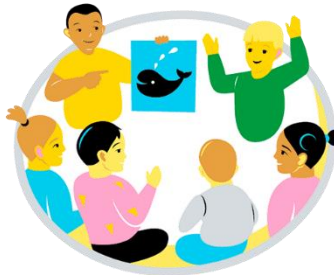
Förmåga att delta och påverka