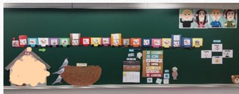
Päiväjärjestyskuvat Canva