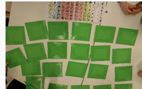
Pelaamisen tukena Kipinäkeskuksen toimitataulu