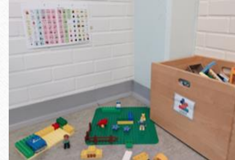
Leikkiä tukemassa Kipinäkeskuksen toimintataulu