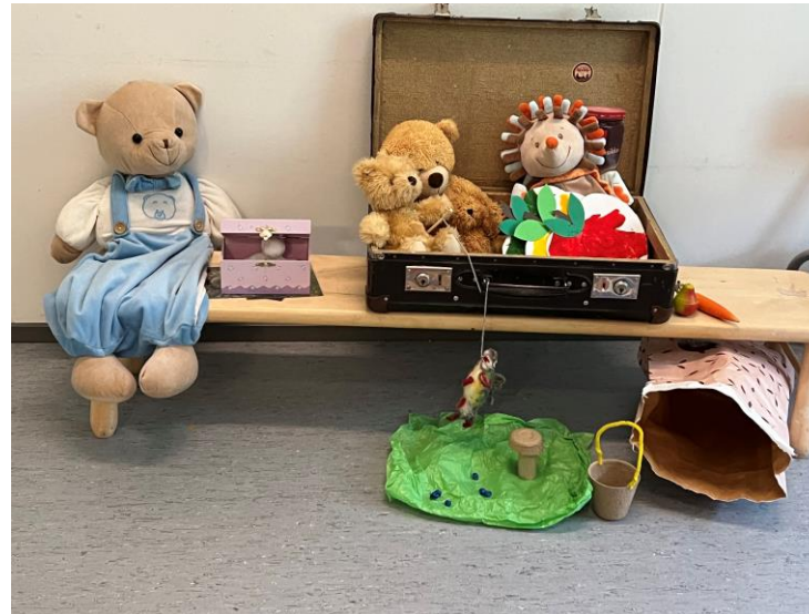
Kuva: Virpi Havu