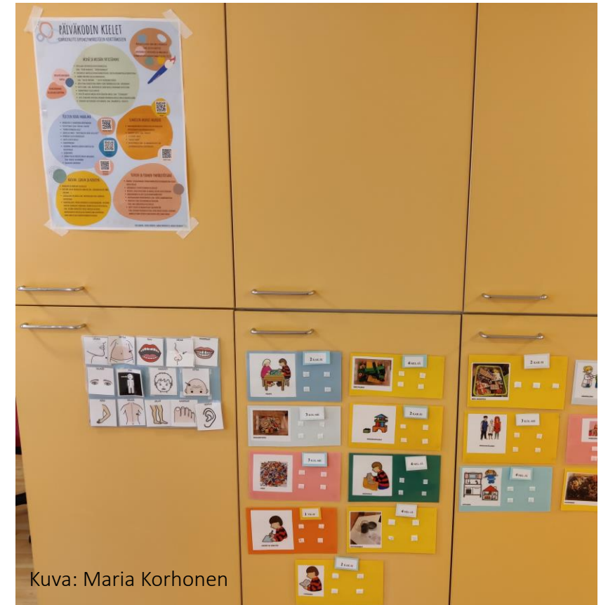
Kuva: Maria Korhonen