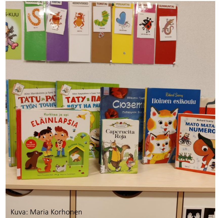
Kuva: Maria Korhonen