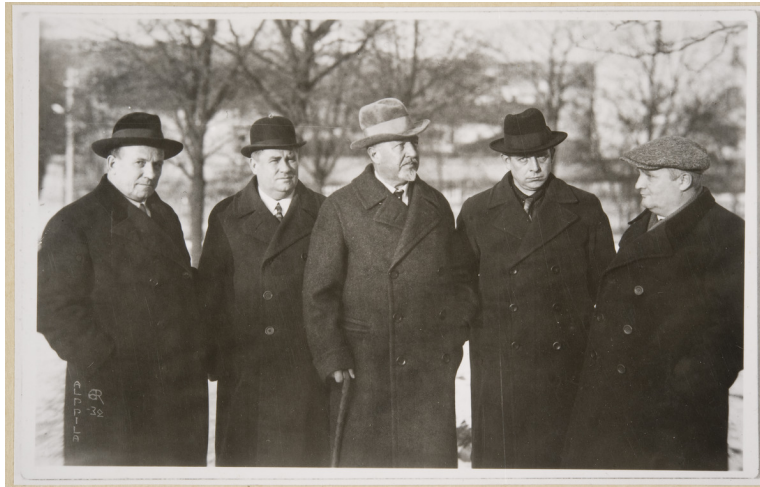
Lapuan liikkeen johtajia vuodelta 1930. Kuvassa vasemmalla liikkeen johtaja Vihtori Kosola.

Olette yhtenäinen joukko maanviljelijöitä sekä tehtaanomistajia. Teille tärkeitä arvoja ovat isänmaallisuus ja uskonto, ja arvostatte rehellistä työntekoa. Koette vääryudeksi työväenliikkeiden toiminnan ja pidätte sosiaalidemokraattista puoluetta uhkana Suomelle. Uskotte, että ilman minkäänlaista vasemmistolaista toimintaa Suomi olisi yhtenäinen maa, ja teillä on sama tavoite, kuin sisällissodassa valkoisissa taistelleilla. Suomen itänaapurin Neuvostoliiton kommunistisen vallankumouksen pelättiin tosissaan levittäytyvän Suomeen. Kunnioitatte presidentti P.E Svinhufvudia, mutta ette ole tyytyväisiä eduskunnan toimintaan, sillä he sallivat sosiaalidemokraattien toiminnan. Liikkeen toimintaan on kuulunut myös äärimmäisiä keinoja, kuten väkivaltaa kyyditysten muodossa sekä työväentaloihin kohdistuvaa ilkivaltaa. Kyydititte muun muassa entisen presidentti Ståhlbergin ja tämän vaimon. Lapuan liikkeen johtaja on Vihtori Kosola, ja te lapualaiset kunnioitatte hänen mielipiteitään.