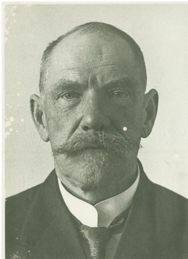
P. E. Svinhufvud, Suomen presidentti vuosina 1931-1937.