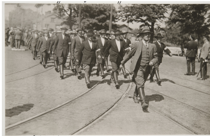
Talonpoikaismarssi Helsingissä kesältä 1930.