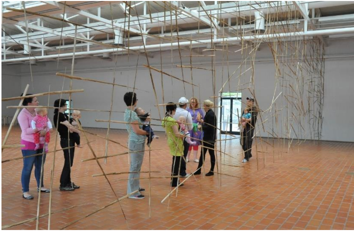
Kuva 1. 4-11kk Vauvojen värikylpy -perheet Porin taidemuseossa. (Kruunupään arkisto 2011).