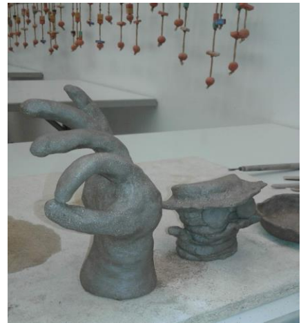
Kuva 1. Lasten savityöt (Tiina Nolte 2021)

Inkeri Ruokonen (2024) kertoo luennossaan harrastajan elämänkaaresta. Siinä korostuu mm. tärkeys antaa tilaa myös kokeilulle ja liikunnalliselle toiminnalle ja vapaalle tekemiselle ilman suoritusavoitteita. Mietin, voisiko myös keramiikkakurssi antaa tilan liikunnalliselle toiminnalle? Pitääkö tunnin lopussa aina syntyä joku pysyvä, poltettava teos vai voisiko saveen kanssa päämäärättömästi vain hassutella? Voisinko liikunnan ja leikillisyyden kautta auttaa lapsia koeta onnistumisen tunnetta ja tueta motivaatiota tekemiseen?