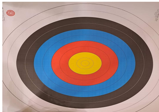
Kuva 2. Jousiammutataulu (Tomi Saario 2023)

Turvallisuusohjeita tulee noudattaa ettei harrastuksessa satu tapaturmaa.