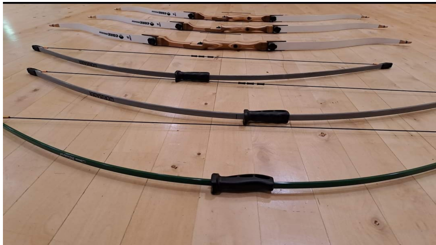
Kuva 3. Jousipyssyt (Tomi Saario 2023)

Ala-asteelaisille suunnattuja jousipyssyjä jouduimme tilaamaan, koska 16-22lb vastakaari jousipyssyt olivat liian jäykkijä ja isoja ala-asteelaisten käyttöön. Nyt pystymme vastaamaan tässä kerhossa ala-asteen toiveeseen harrastaa jousiammuntaa.