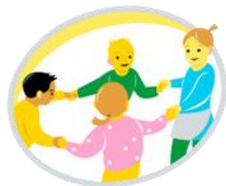
Minä ja meidän yhteisömme