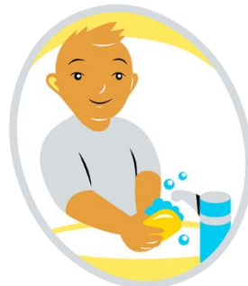
Itsestä huolehtiminen ja arjen taidot