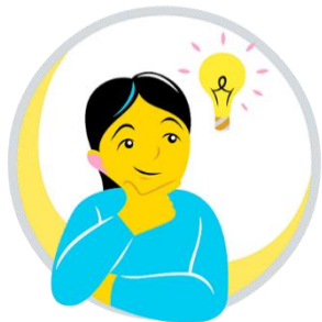
Ajattelu ja oppiminen