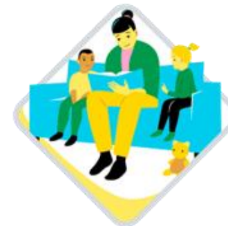
Kielten rikas maailma