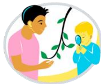
Tutkin ja toimin ympäristössäni

Huomaa tämä! –merkki: huomion kiinnittämiseen johonkin tärkeään asiaan