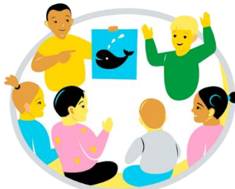
Osallistuminen ja vaikuttaminen