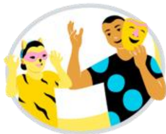
Ilmaisun monet muodot