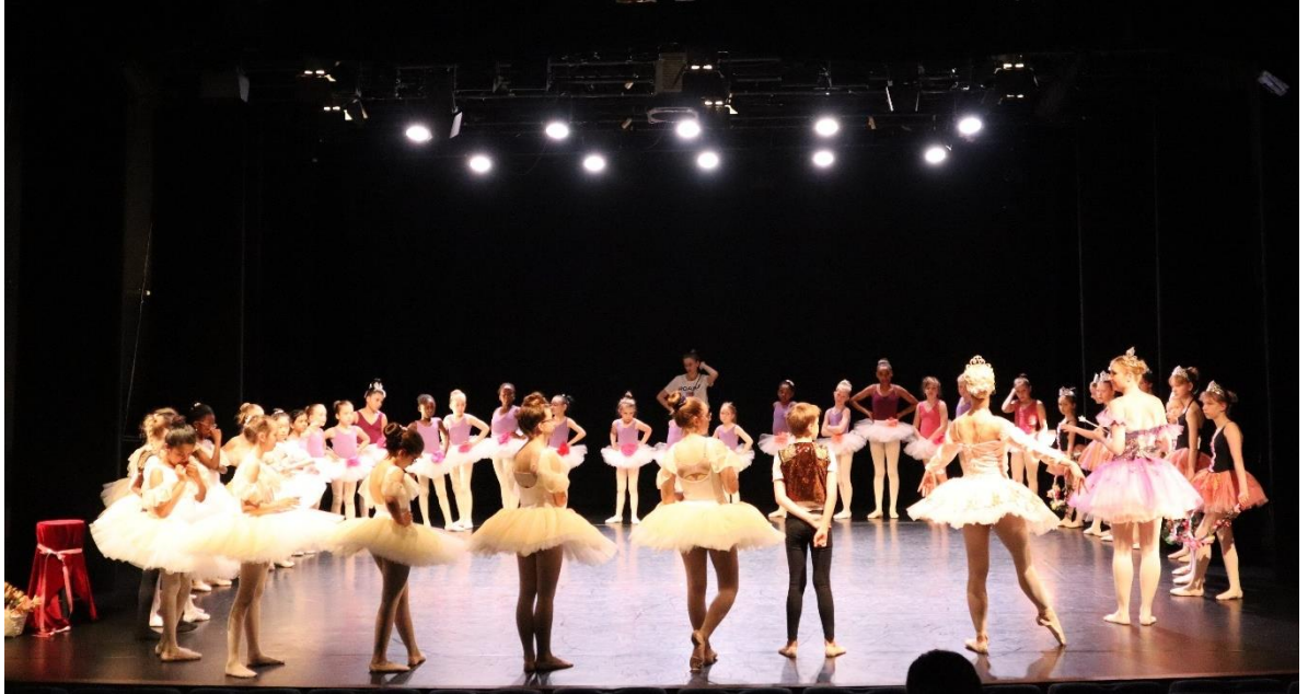
Kuva 1. Balettioppilaita ryhmien näytösharjoituksessa

on pyritty huomioimaan tunneilla perustuen havaintoihin ja kokemuksiin, joita on kertynyt balettituntien aikana. Kuvassa 1 on balettioppilaita harjoittelemassa näytöstä varten Hällä-näyttämön lavalla keväällä 2024.